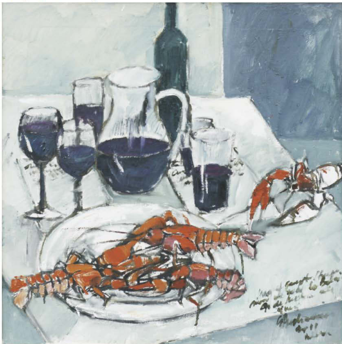
Pofta vine trăind