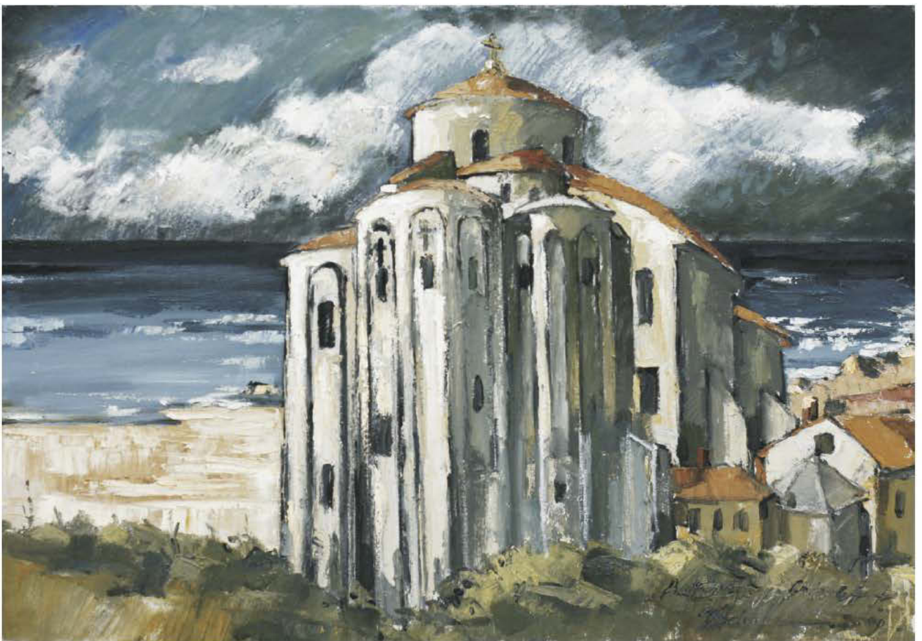
Se aud bătăile unei inimi de Crist