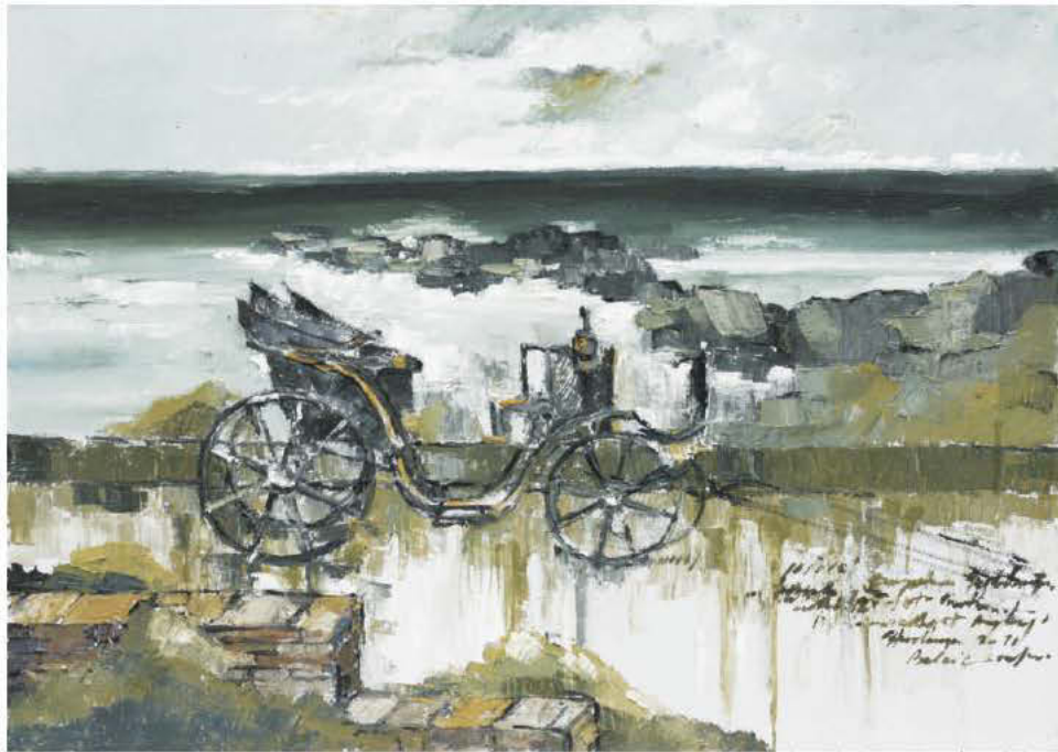
Trăsura lui Poseidon așteaptă la scara valului