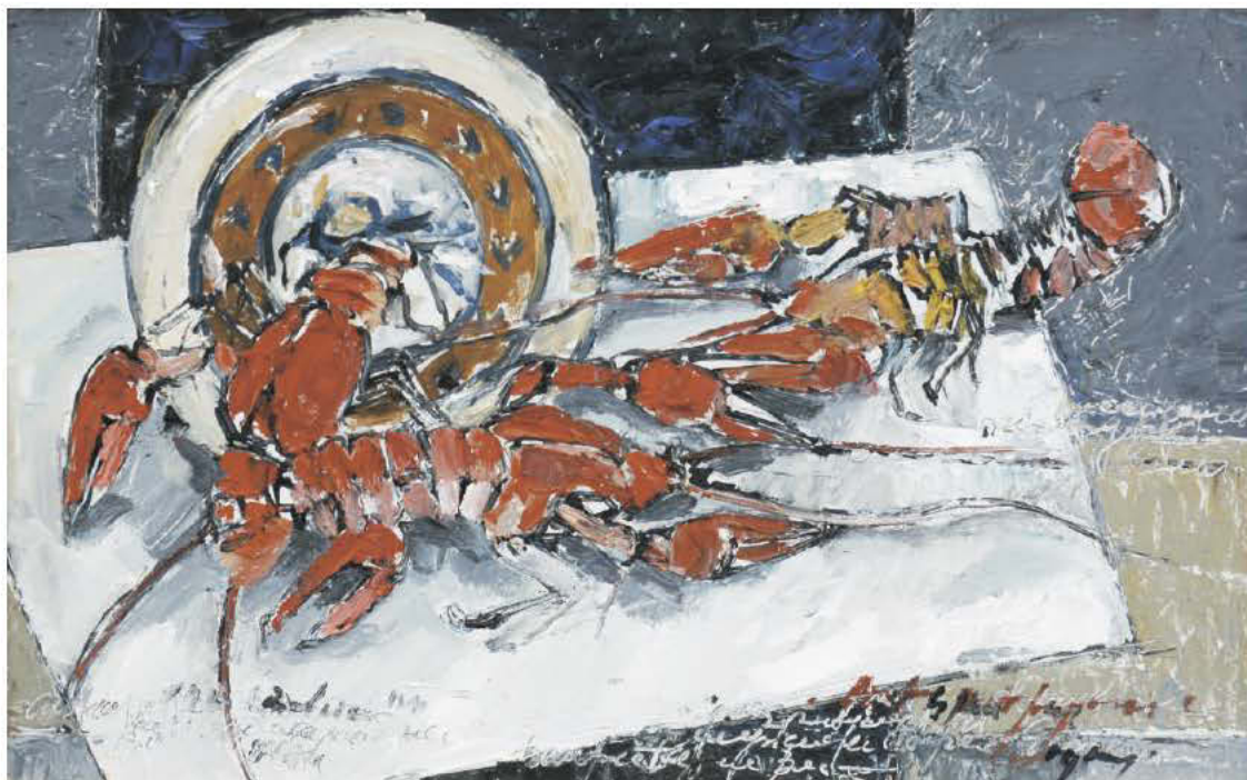
Odă gurmanzilor de apă dulce