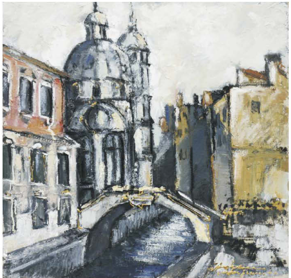
Punte între o singurătate și alta