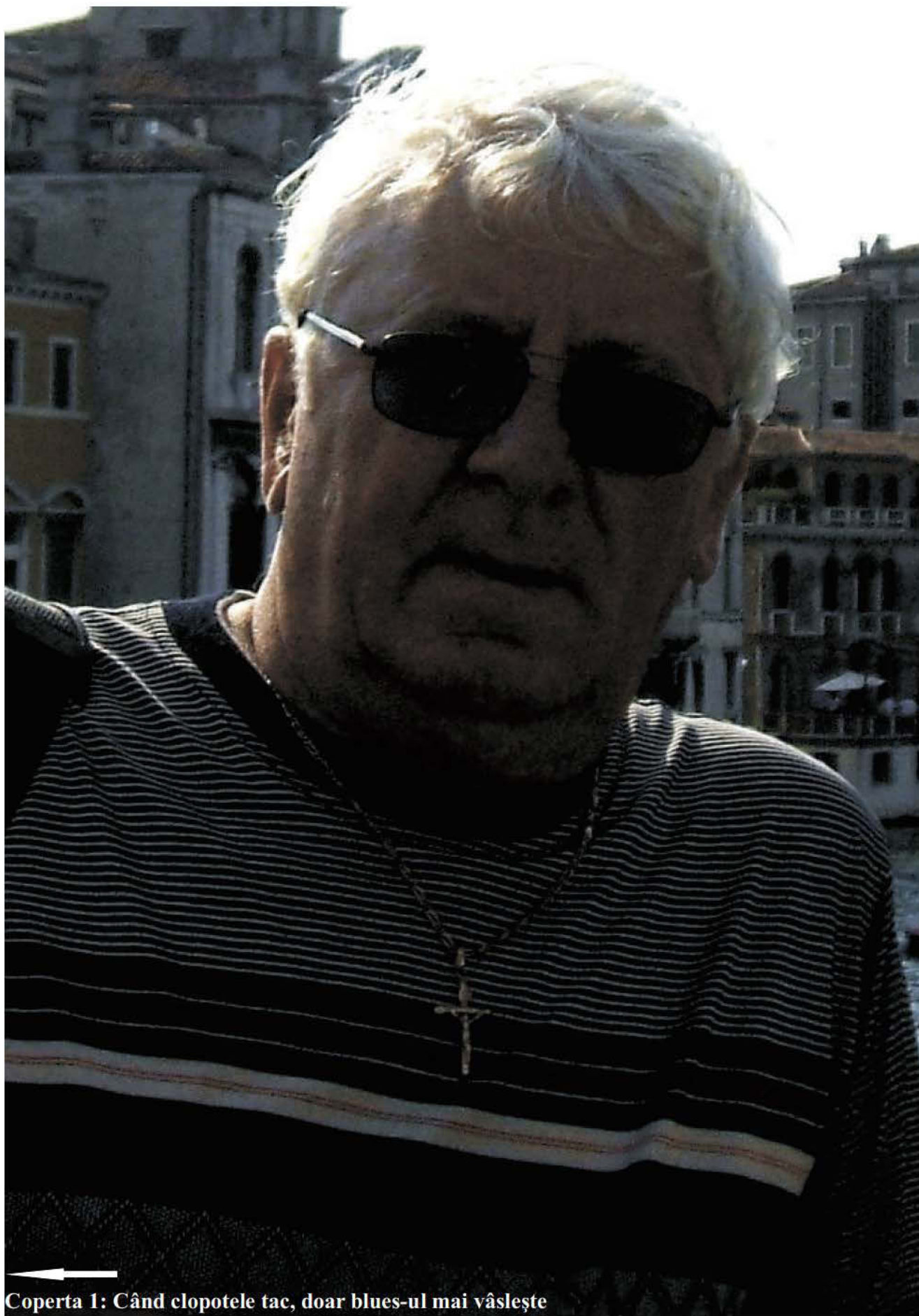
Coperta 1: Când clopotele tac, doar blues-ul mai vâslește

Reflecții pe marginea lucrărilor - Katia Nanu