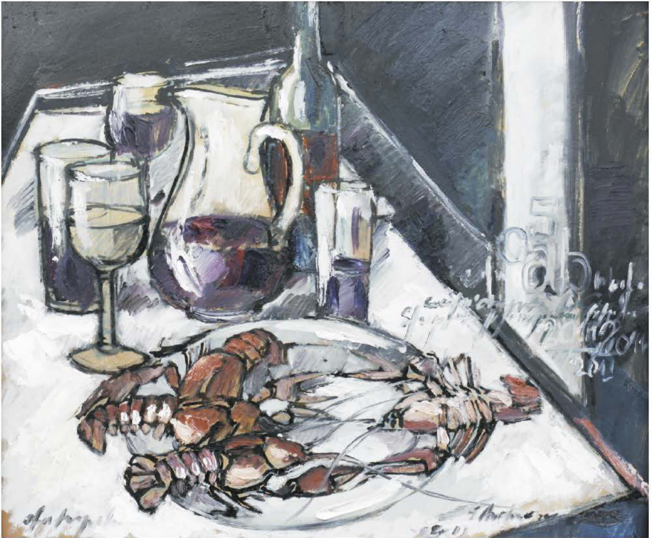
Un pahar de vin pentru sufletul racilor