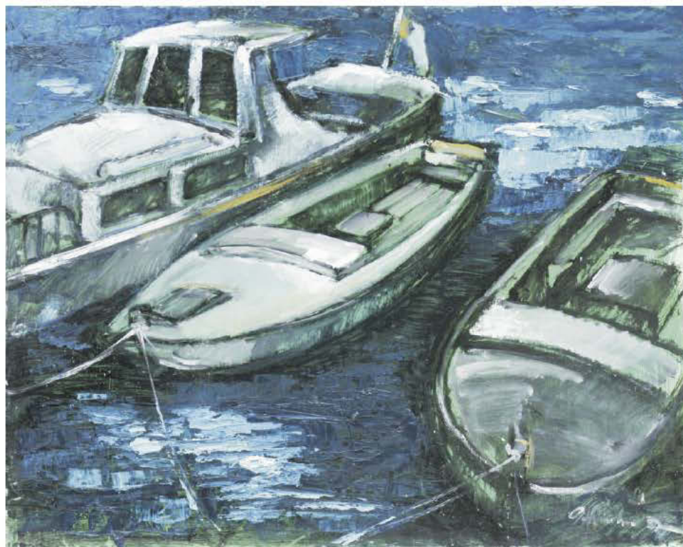
60x40 cm, u/c, 2010