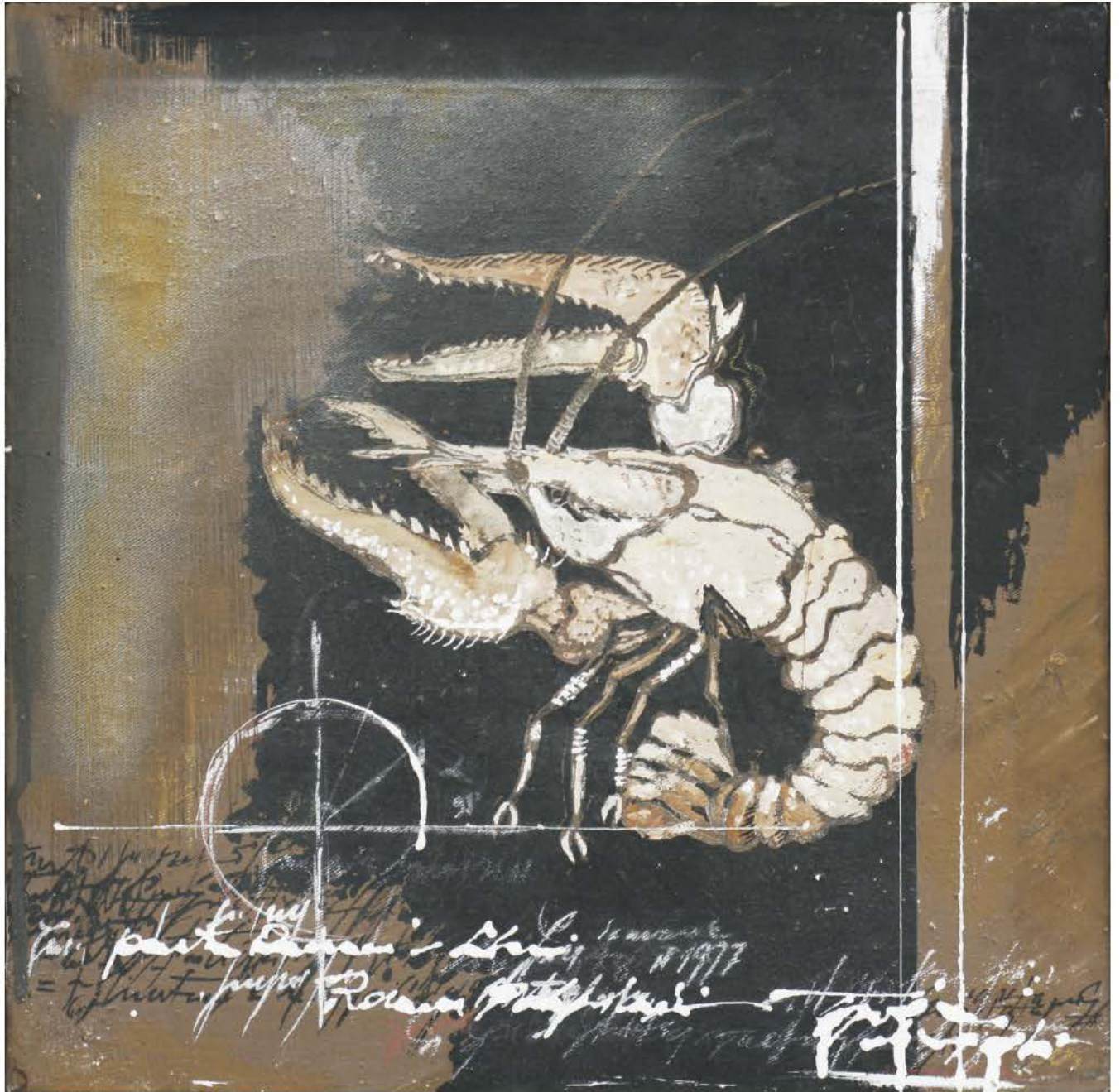
41x41 cm, u/p, 2011