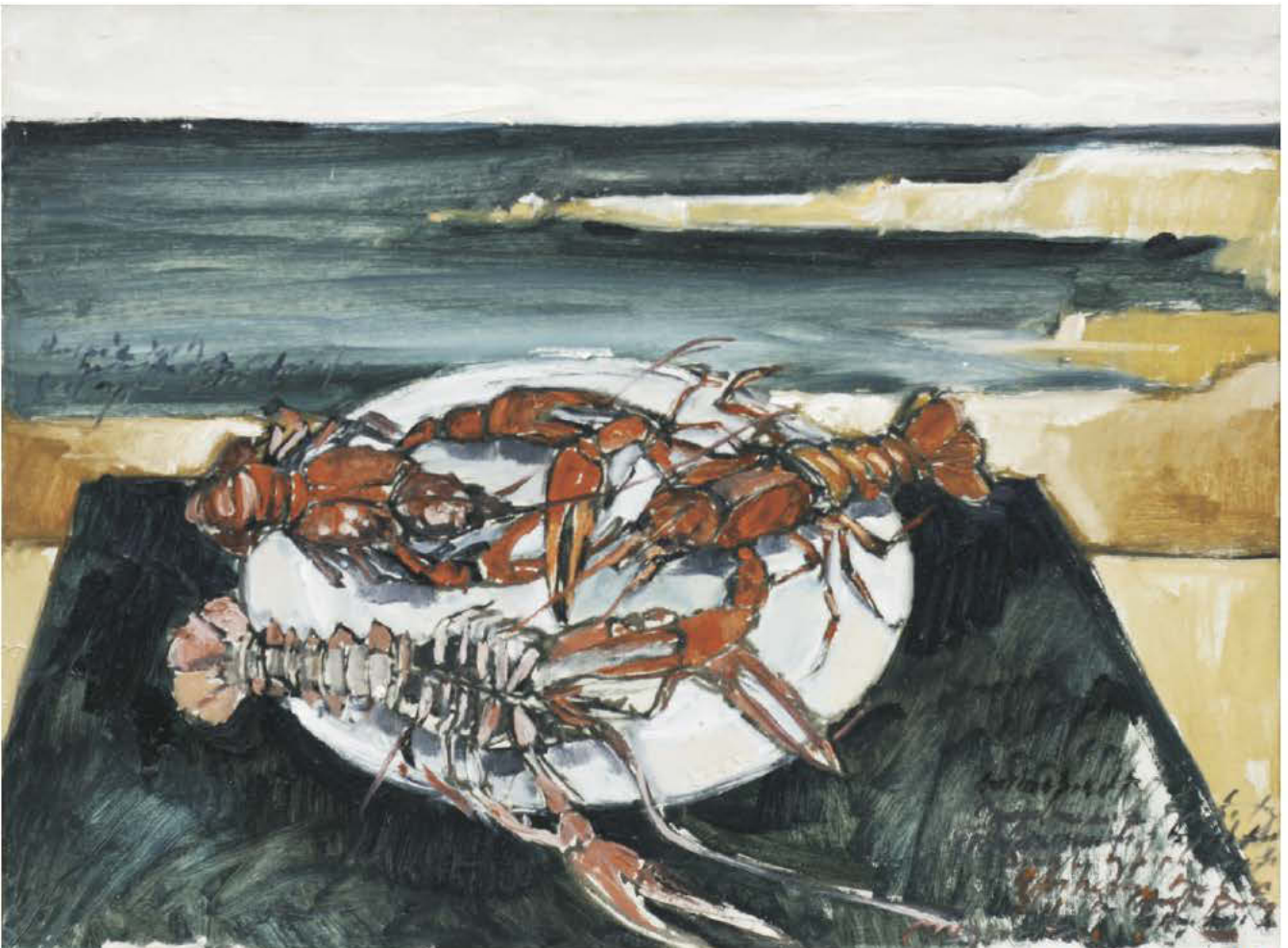
Dăruind, apa ne dobândește