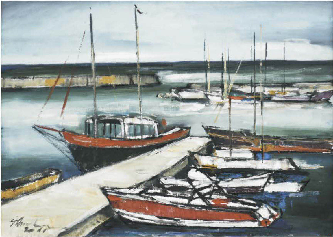
Netrăitele plecări acostează mereu în port