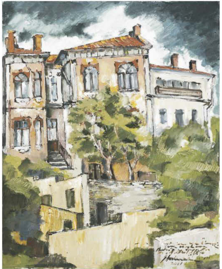
Furtuna gândurilor trage obloane la ferestre