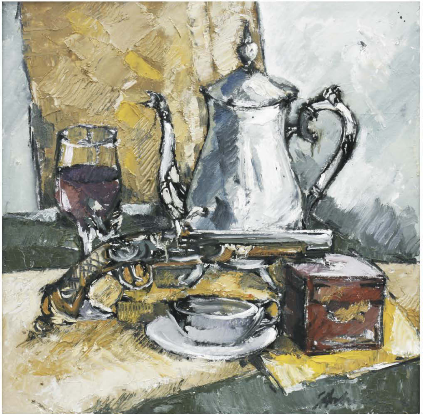
Natură moartă cu pistol viu