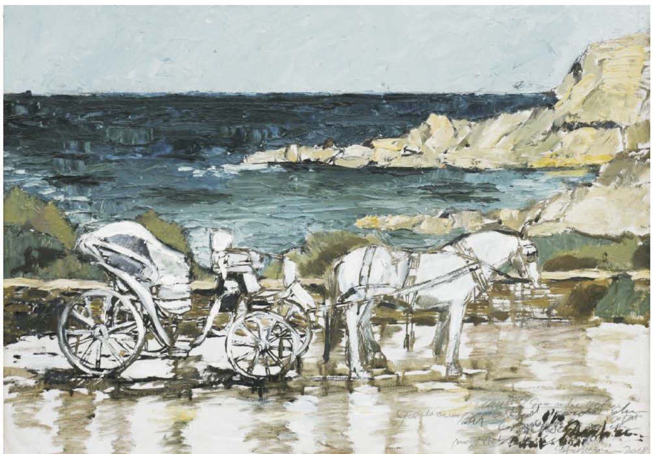
Trăsură pentru mai târziu