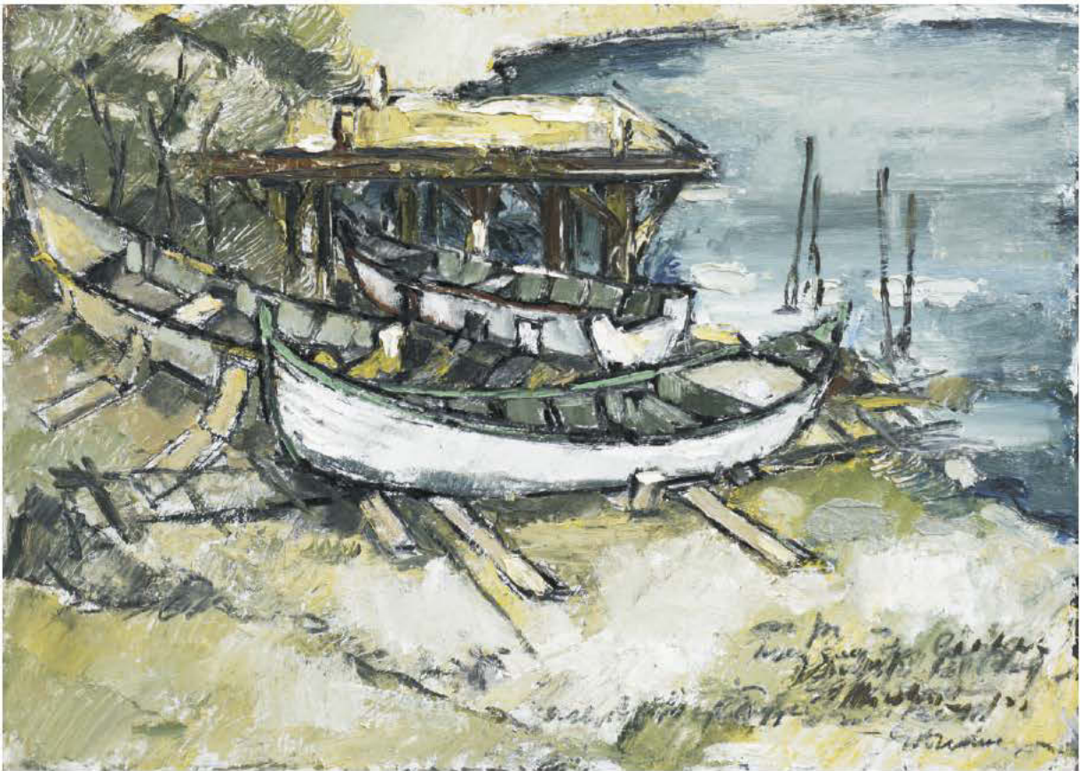
Trei argumente ratate la știința navigației