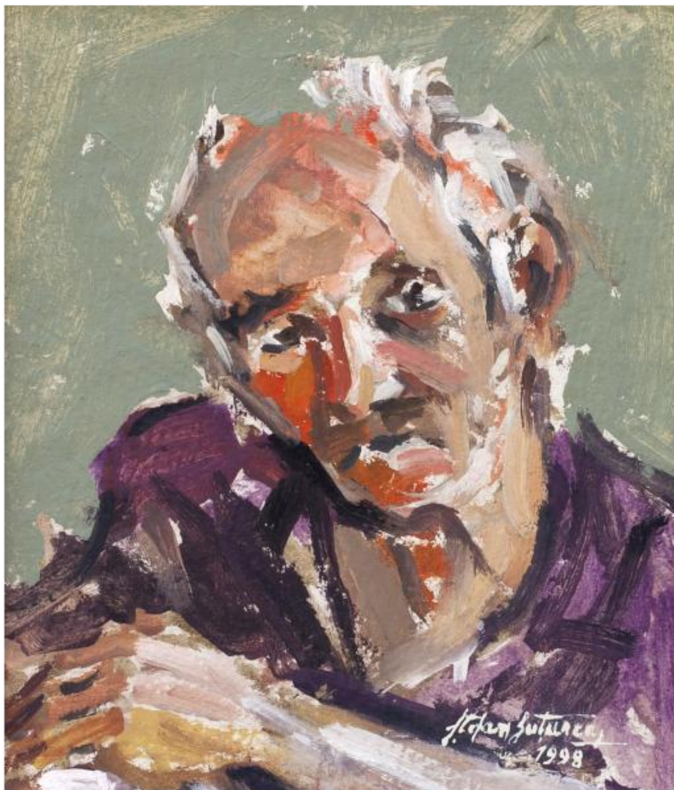
BĂTRÂN PE GÂNDURI ulei carton, 18,3 x 21,3 cm, 1998