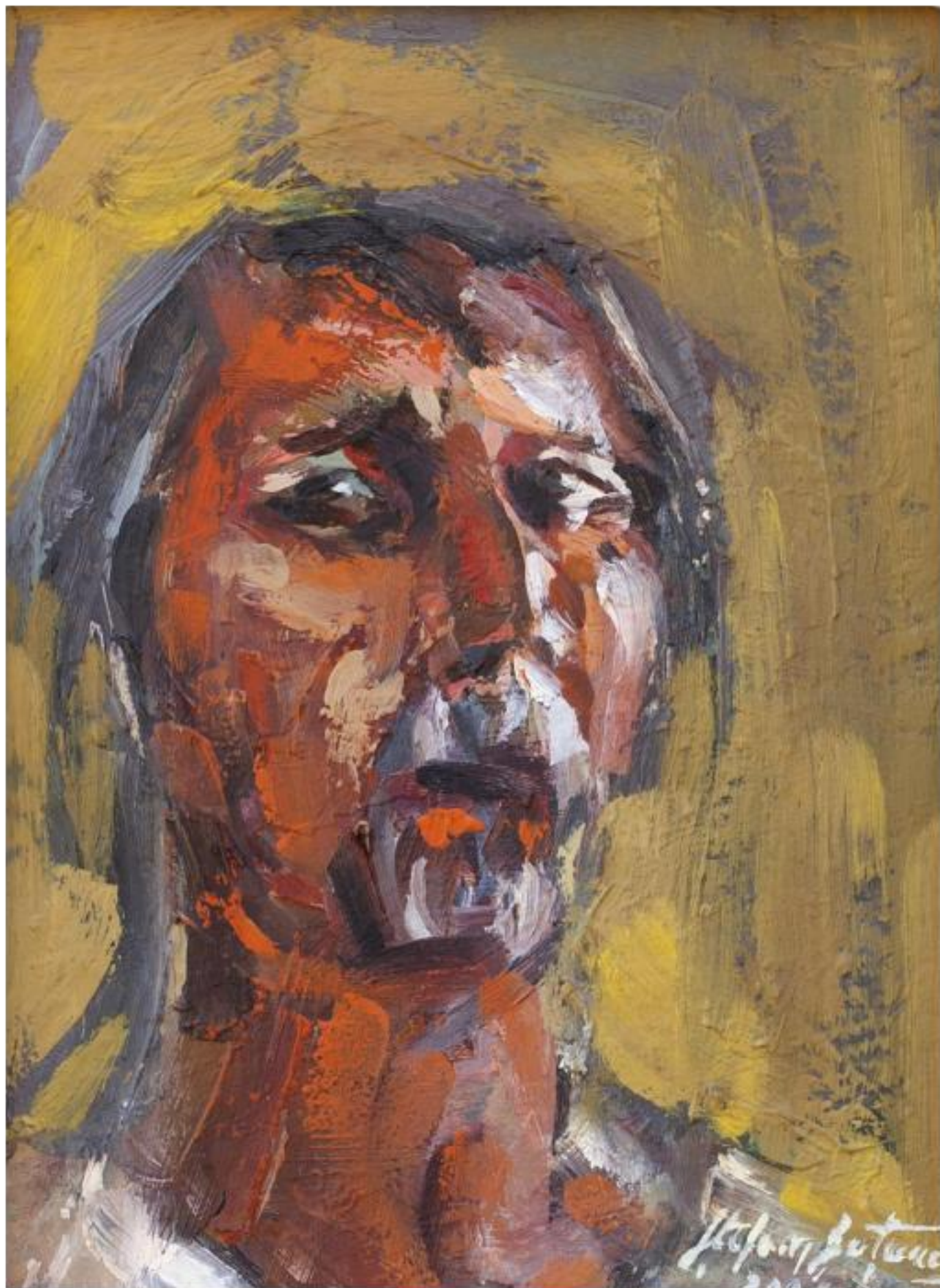
AUTOPORTRET, ulei carton, 16,7 x 21,7 cm, 2004