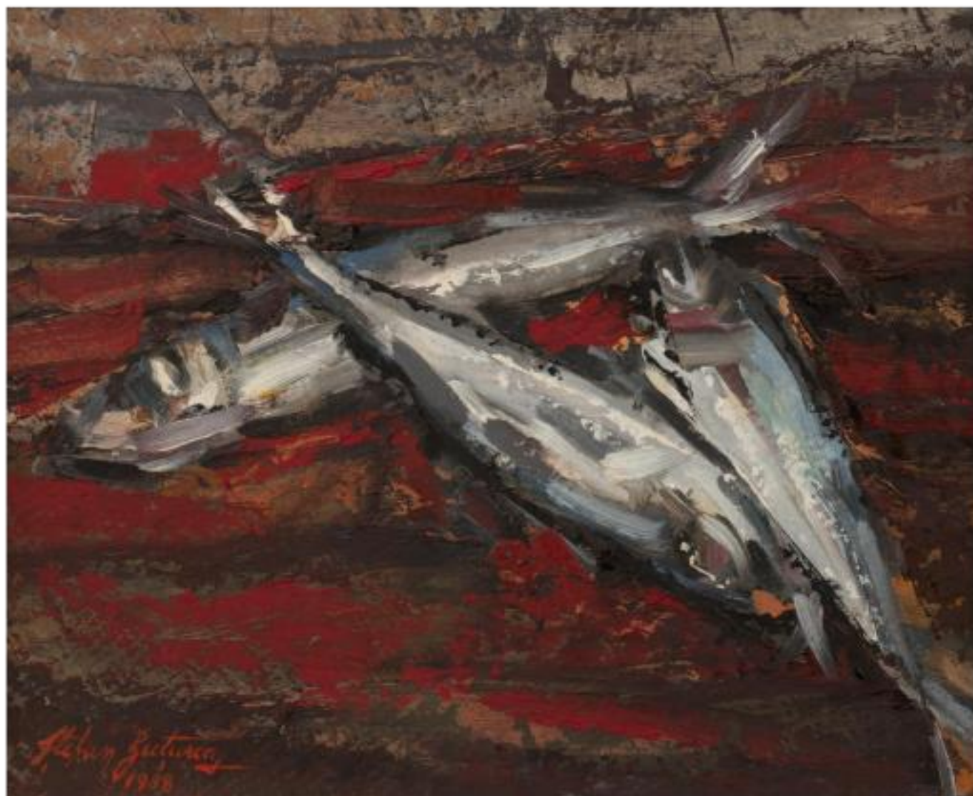
PEȘTI PE FOND ROȘU, ulei carton, 23,3 x 27,8 cm, 1998