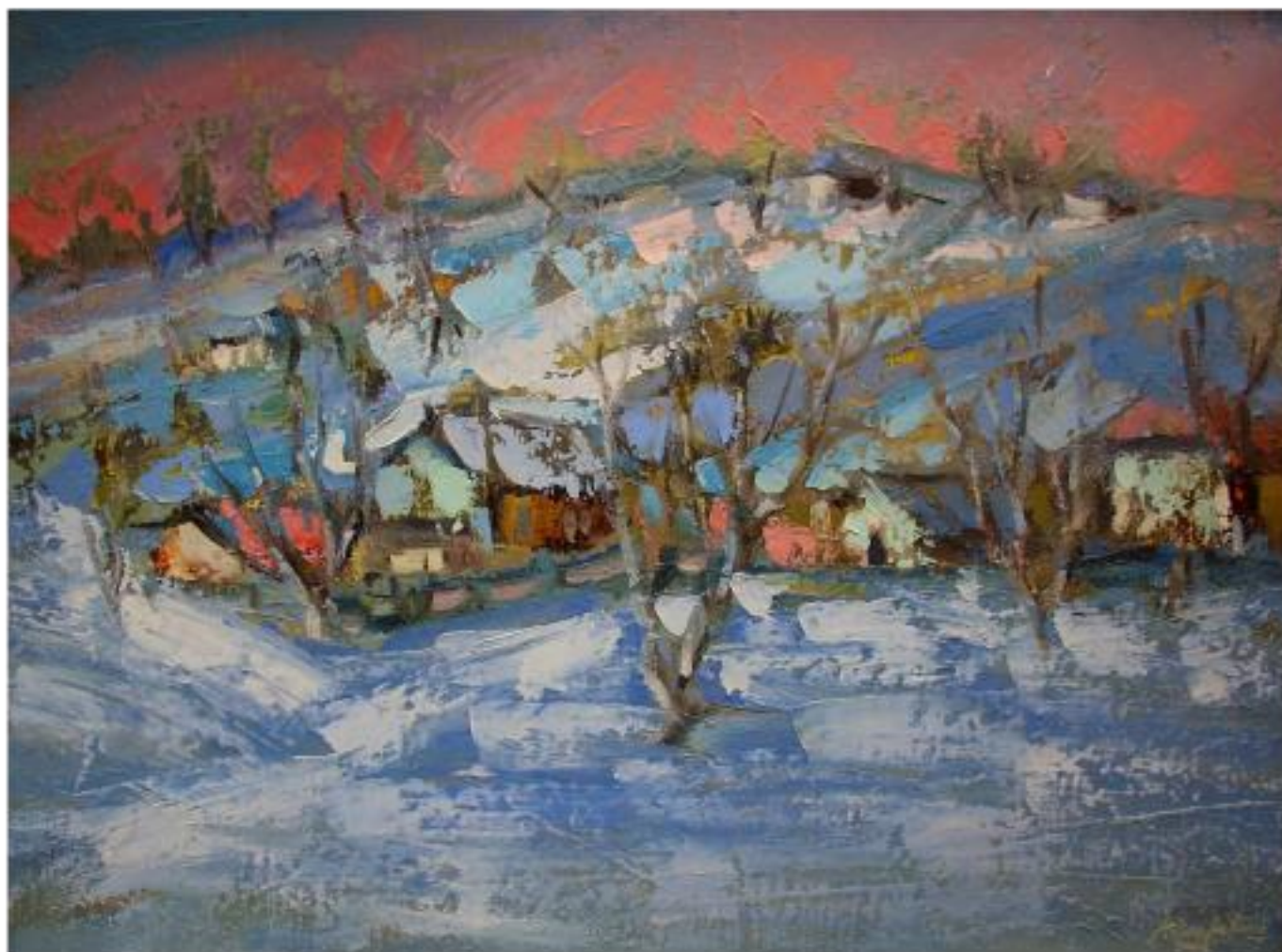
ÎNSERARE ÎN IARNĂ, ulei pânză, 46 x 61,2 cm, 2004

"[...] O pensulație nervoasă și expresivă, o pastă bine nutrită ne poate duce cu gândul la Petrașcu, dacă paleta sa n-ar fi mai luminoasă, melancolizând grigorescian într-un peisaj calm, toropit pe orizontală, în amieze însorite, cu parfum rural. (...)