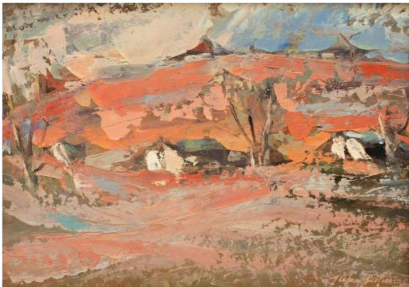
PEISAJ ARID ulei carton, 23,8 x 33,4 cm, 2004