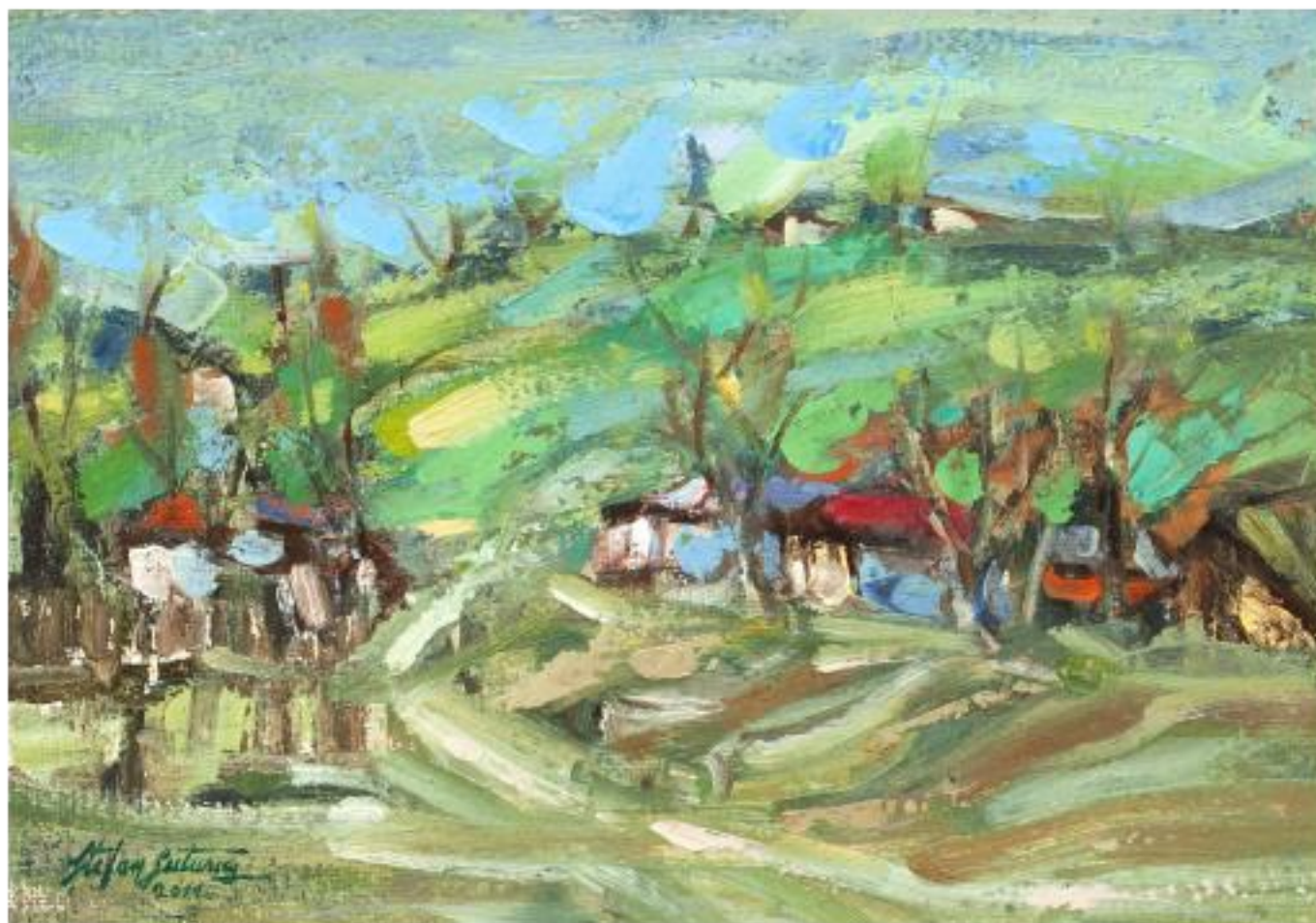
CĂRARE LA MARGINEA SATULUI, ulei pfl, 24 x 34 cm, 2011

"[...] Ștefan Buțurcă este un artist al culorilor energic armonizate în compoziții echilibrate, gândite cu seriozitate profesională. Tușa dinamică, forma obiectului, aerul mișcat parcă, de neliniștite efluvii, confirmă o înțelegere nuanțată a funcției culorii. Artistul știe să elaboreze o compoziție rațională, să surprindă și să transmită individualitatea subiectului pe care și l-a ales. (...) Cred însă, că talentul lui de colorist e îndeajuns de puternic încât să se poată defini curând, după o tenace scrutare a unui orizont tematic pe potriva propriului temperament. [...]"