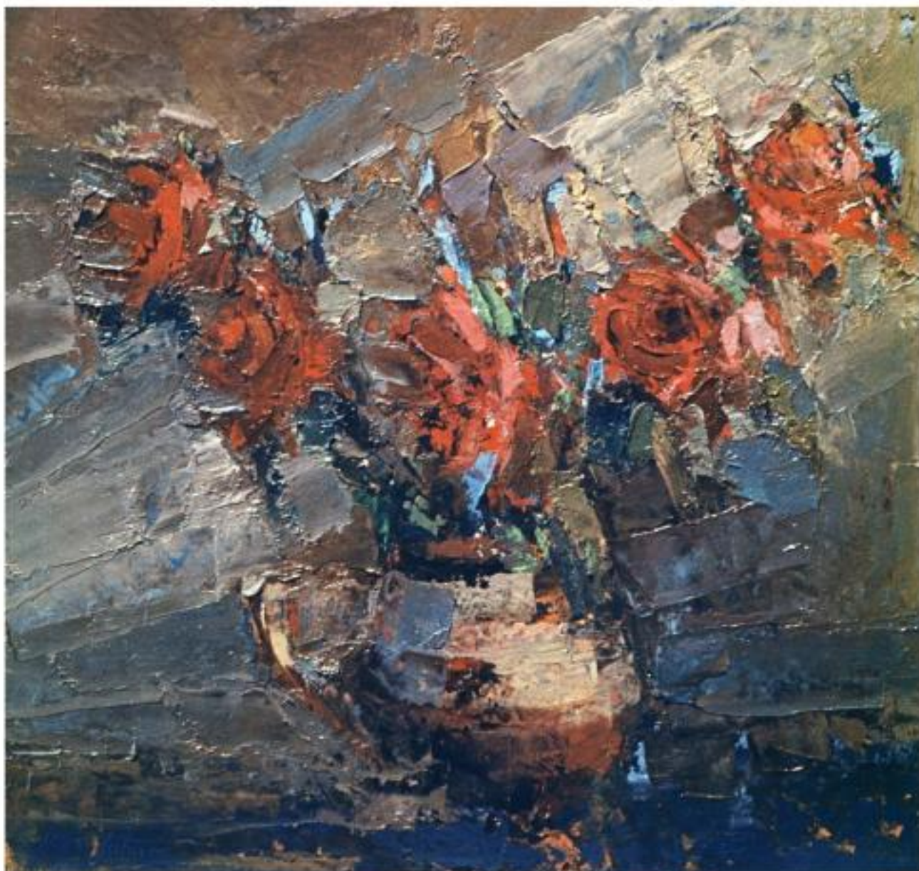
TRANDAFIRI ROȘII ulei carton, 32 x 34 cm, 1986