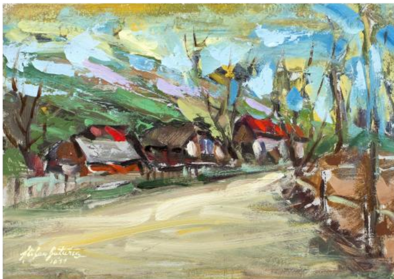
STRUCTURI SUB CERUL TOAMNEI, ulei pfl, 24 x 34 cm, 2011

[...] În arta sa, aproape nimic nu se repetă, nu atât sub raportul elementelor – unei nature statice sau a unui peisaj – cât mai ales a atmosferei. În peisaj, de pildă, atmosfera din "Spre curtea lui moș Ion" respiră alt timp și altă poveste, cu o gravitate conferită de forța tușei, a accentelor vibrante, a energiei cromatice, față de cea din "Colț de sat la Poiana" – un eseu plastic de mare rafinement, o "copertă" dintr-o poveste, desprinsă parcă din timpuri imemorabile. Naturile statice cu flori deschid un alt capitol de măiestrie din creația sa, saturat cu stăluciri de pastă, îmbibat de poezie și senzualitate. [...]"