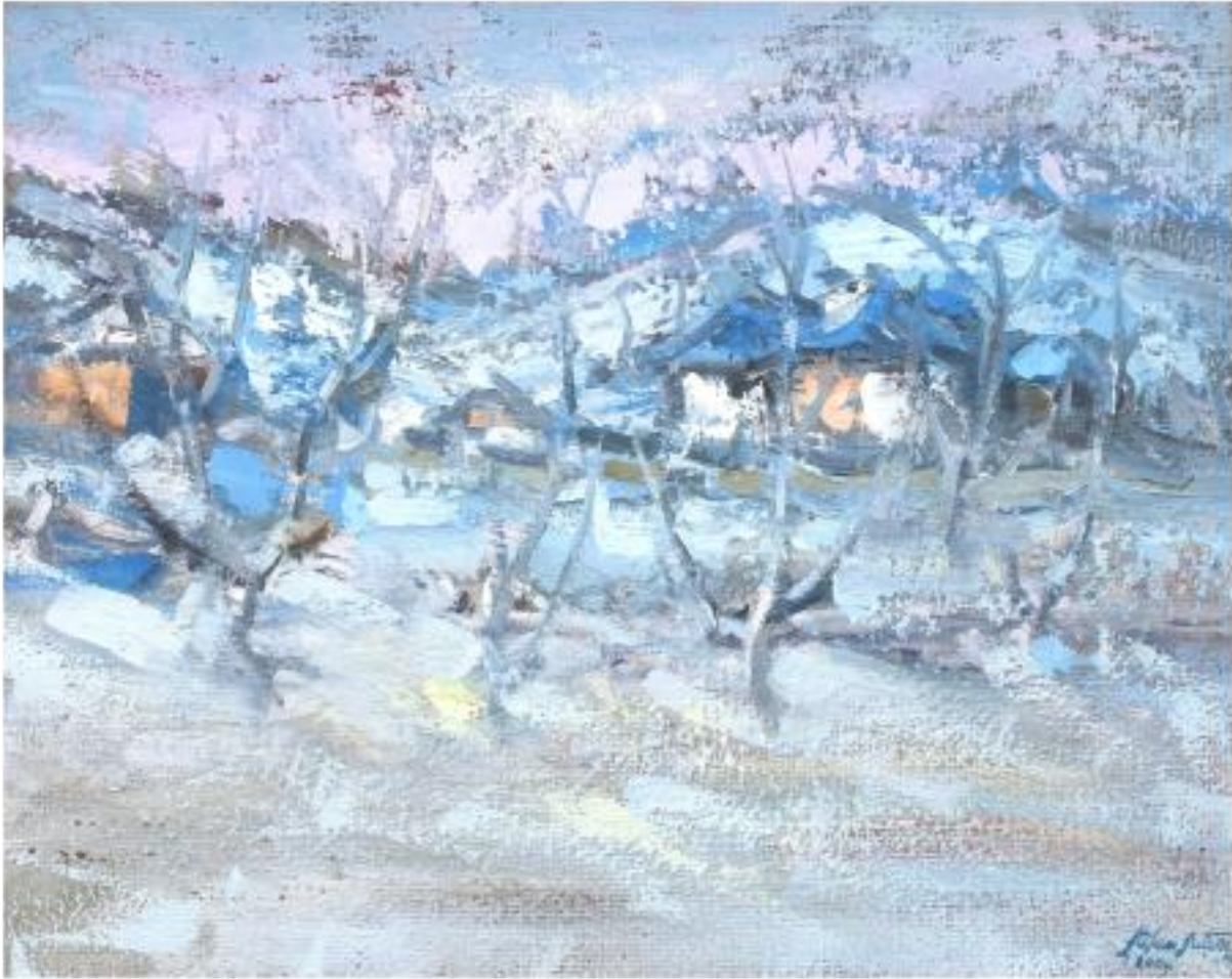
IARNĂ ÎN ALBASTRU, ulei pânză, 43 x 54 cm, 2003

Concepție catalog și organizare expoziție: Alexandru Pamfil Tehnoredactare computerizată: Alexandru Pamfil