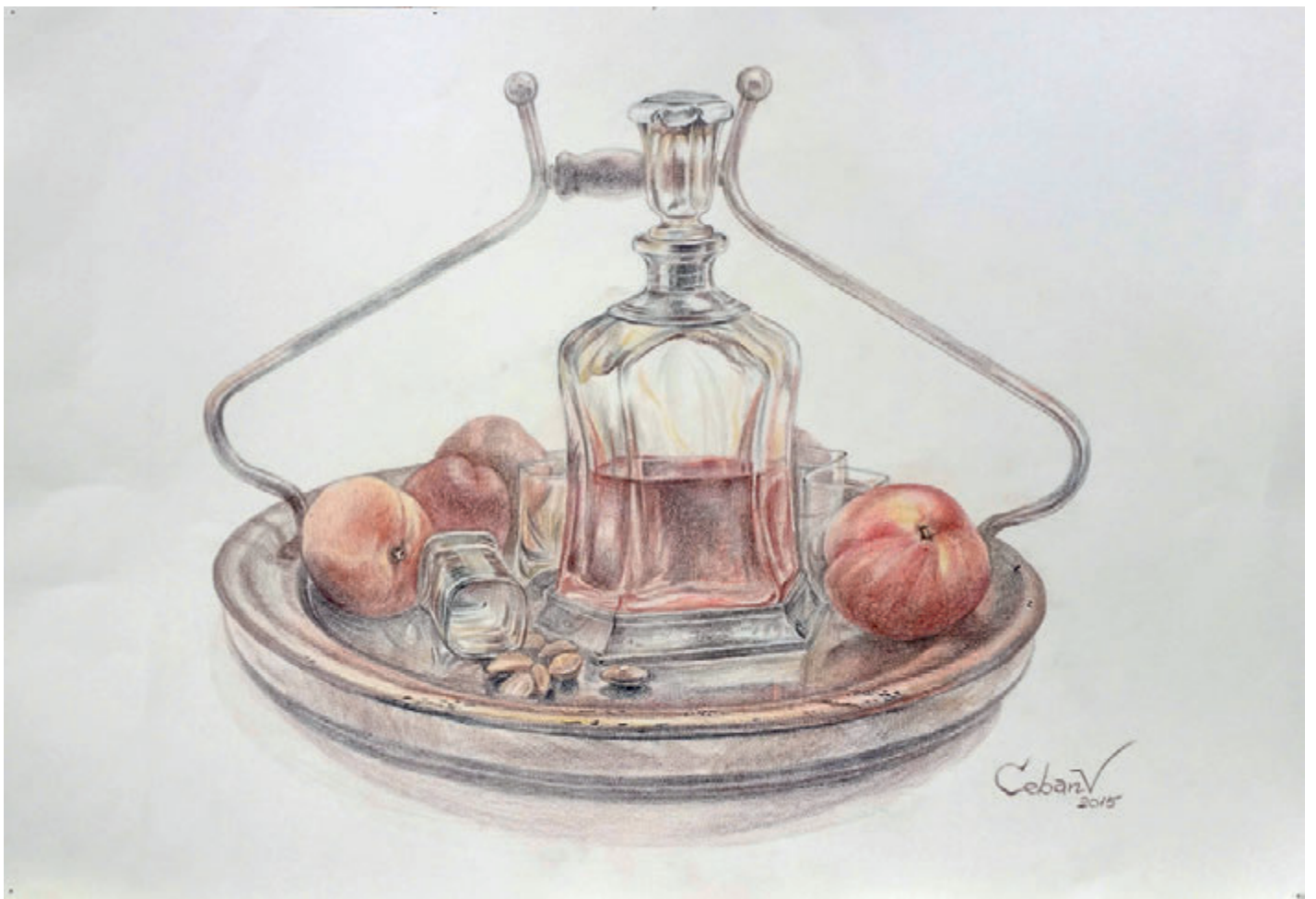
Piersici, creion cerat pe hârtie