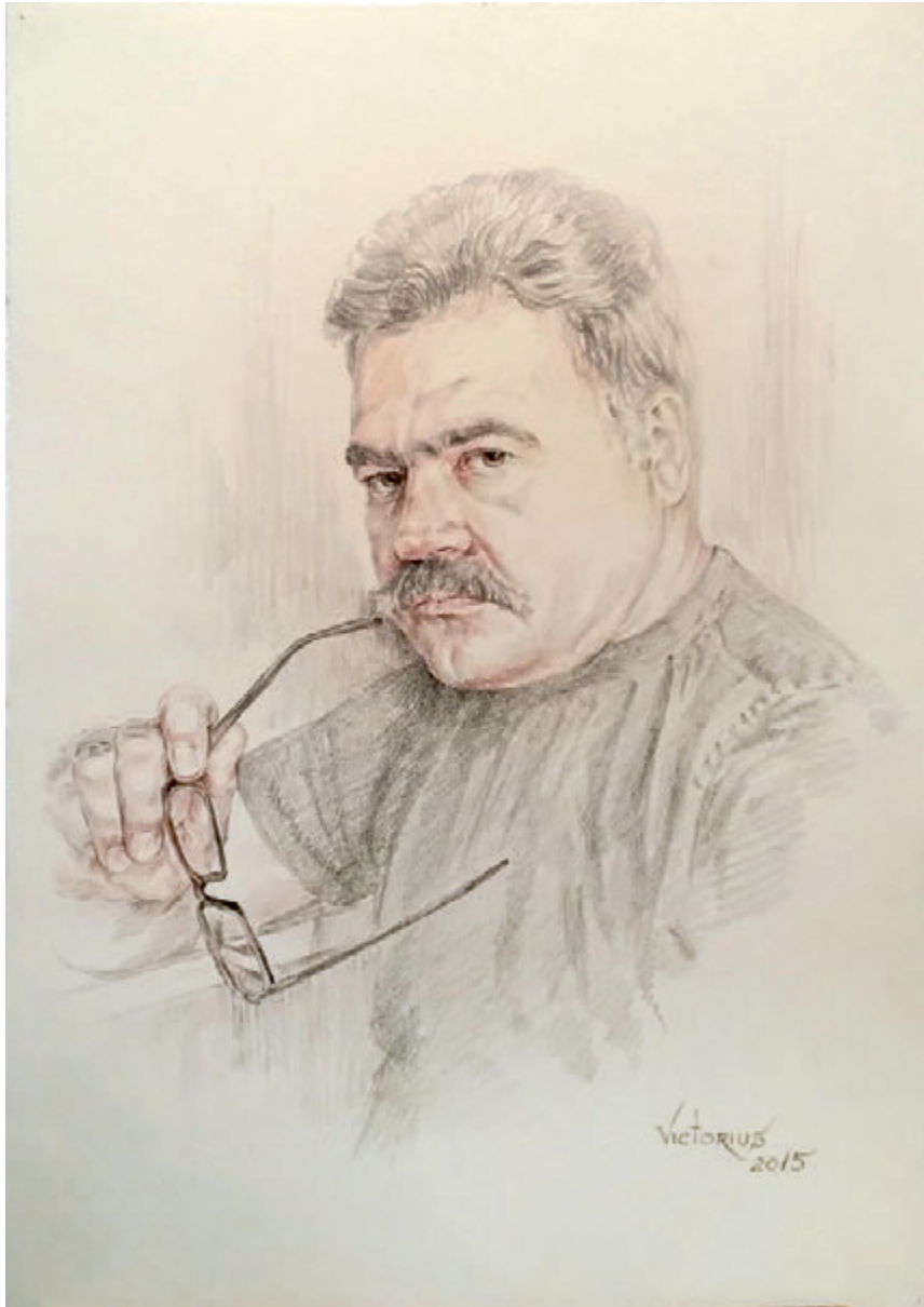
Autoportret, creion cerat pe hârtie