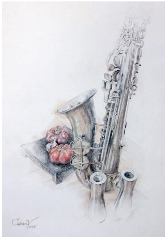
Sax, creion cerat pe hârtie