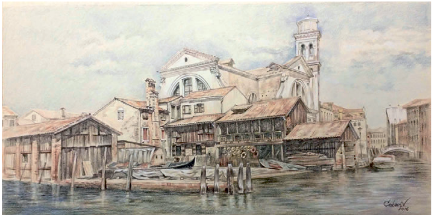
Venezia gondole cantiere, creion cerat pe hârtie