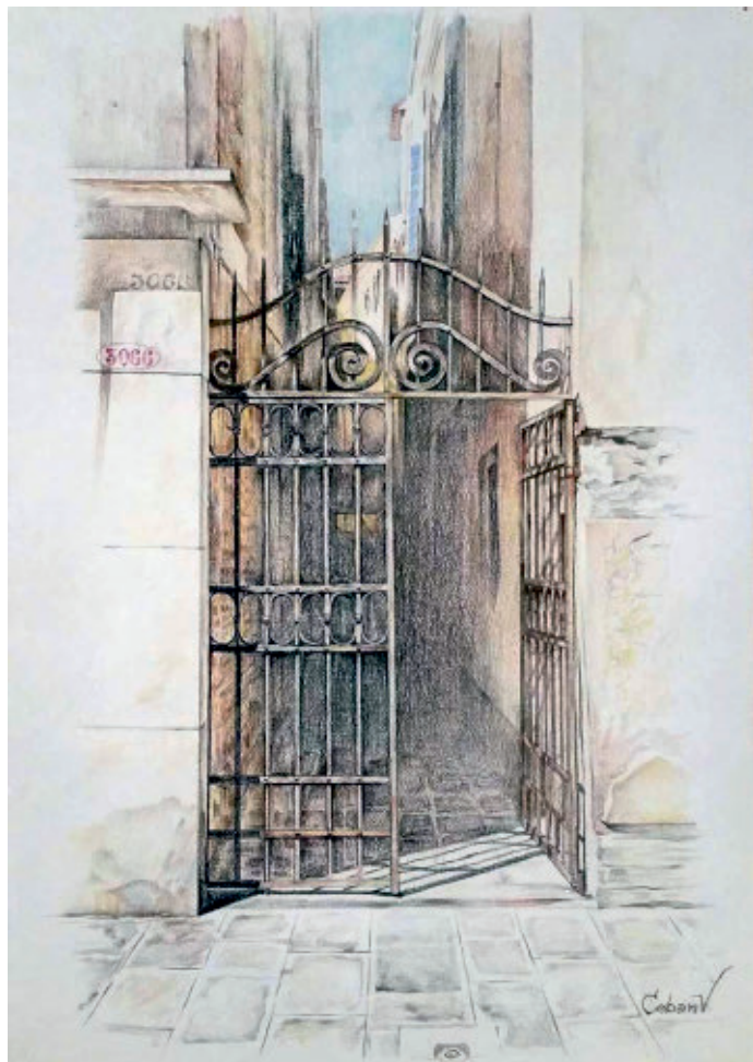
Poarta veche Venețiană (Vecchio Cancellò), creion cerat pe hârtie