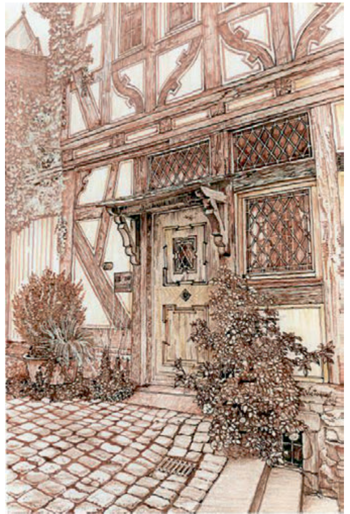
Vechea Germanie, peniță, tuș, creion cerat pe hârtie