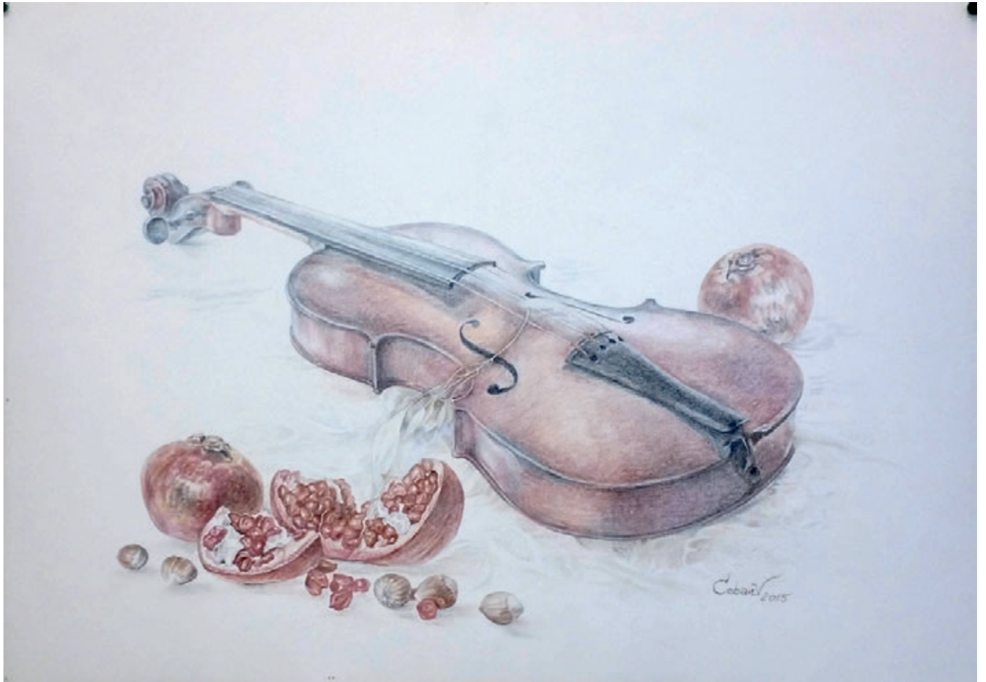
Vioară și rodii, creion cerat pe hârtie