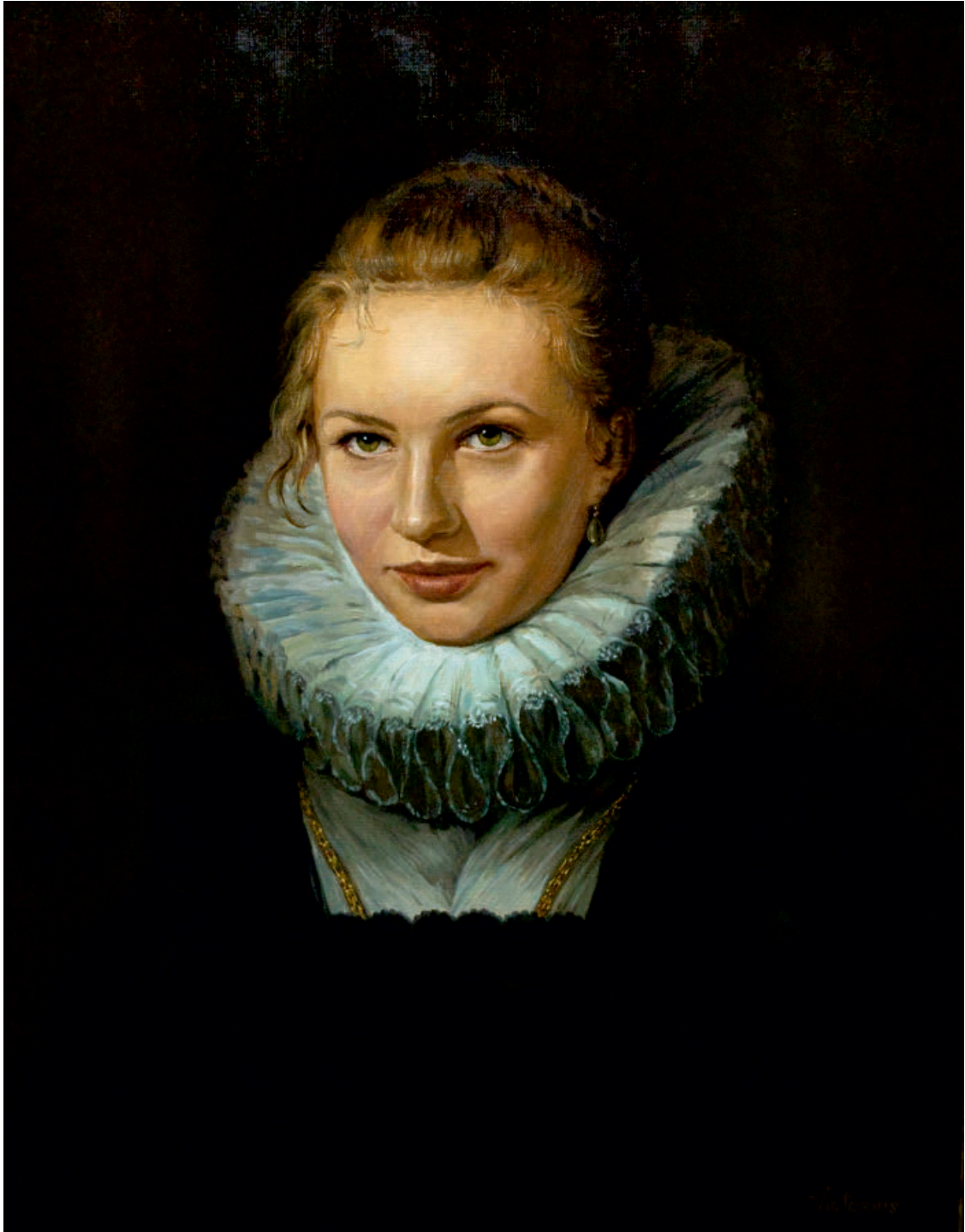
Tatiana, ulei pe pânză