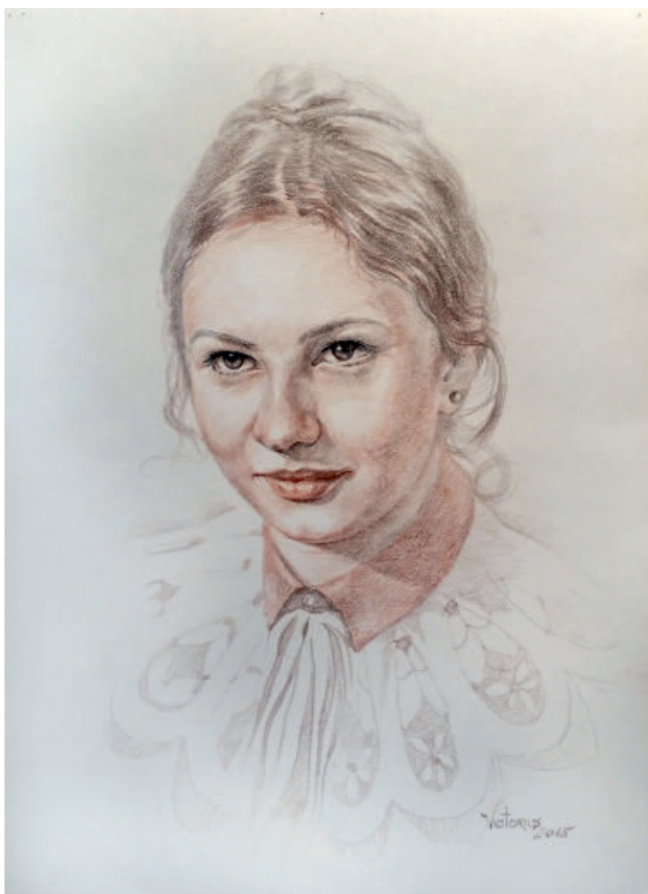
Tatiana , creion cerat pe hârtie