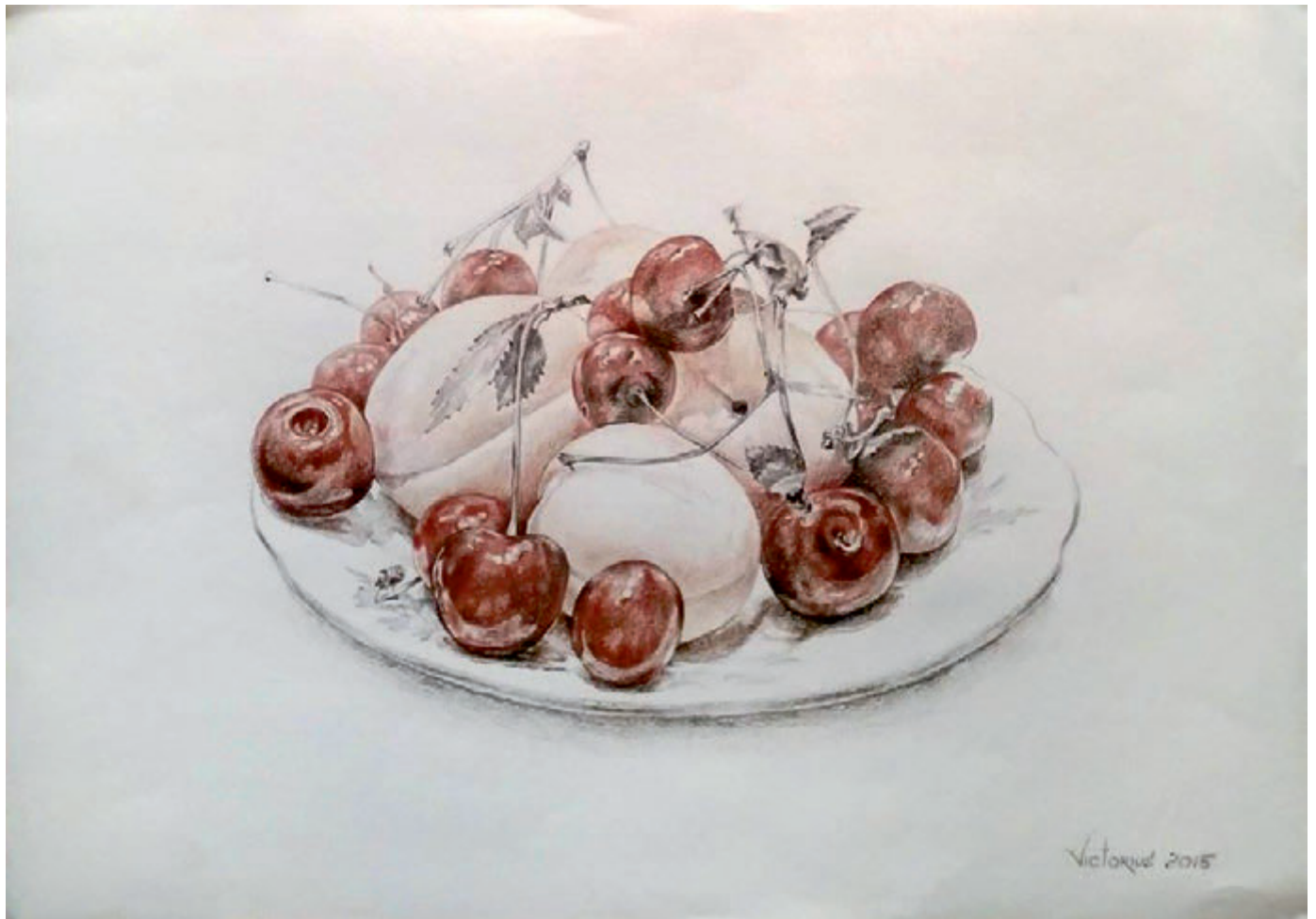
Cireșe, creion cerat pe hârtie