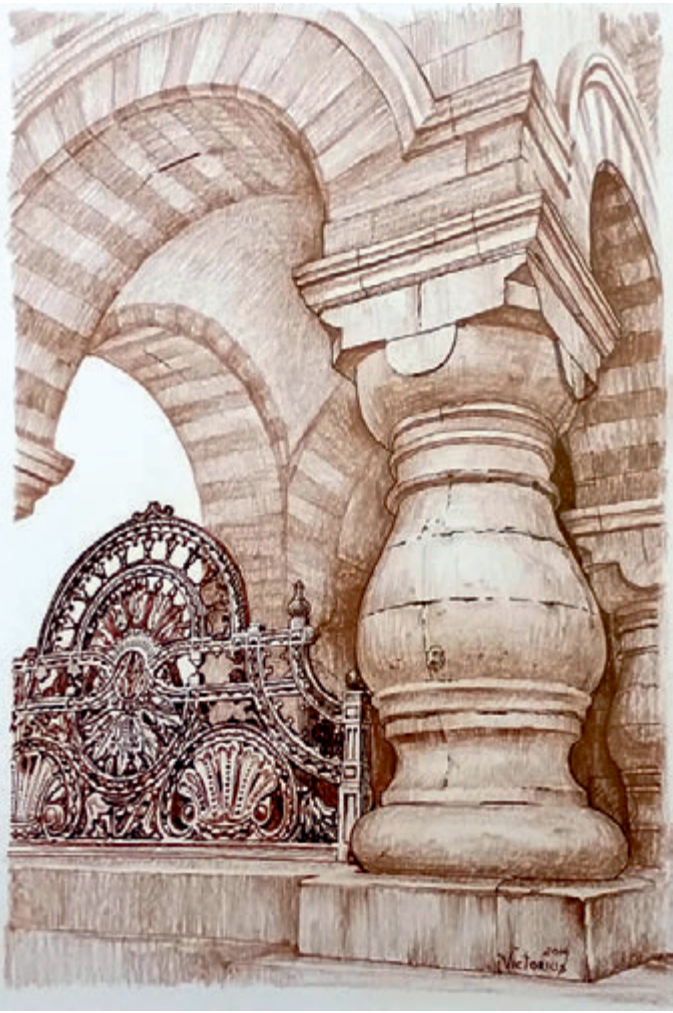
Capela, peniță, tuș, creion cerat pe hârtie