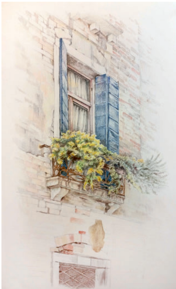
Fereastra, creion cerat pe hârtie