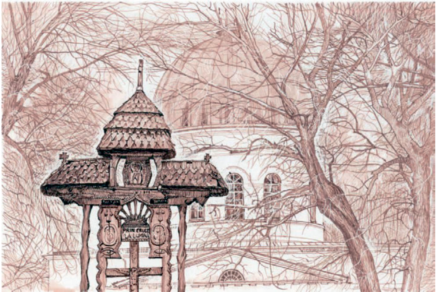
Prin Cruce la Lumină, peniță, tuș, creion cerat pe hârtie