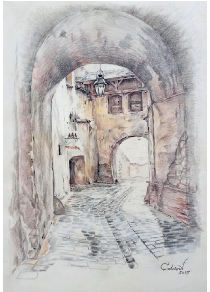
Sighișoara, creion cerat pe hârtie