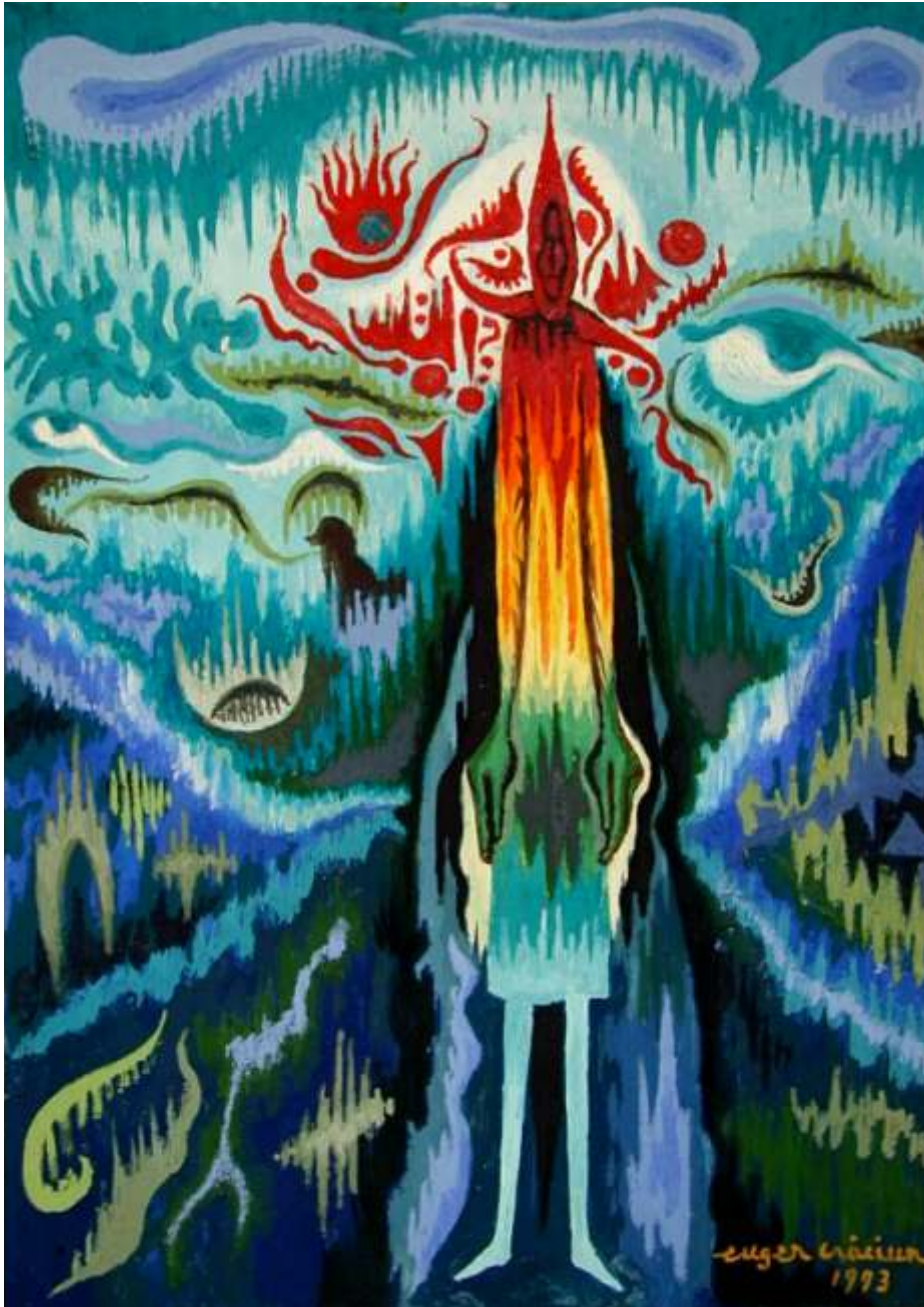
Taranca hazlie, 1993