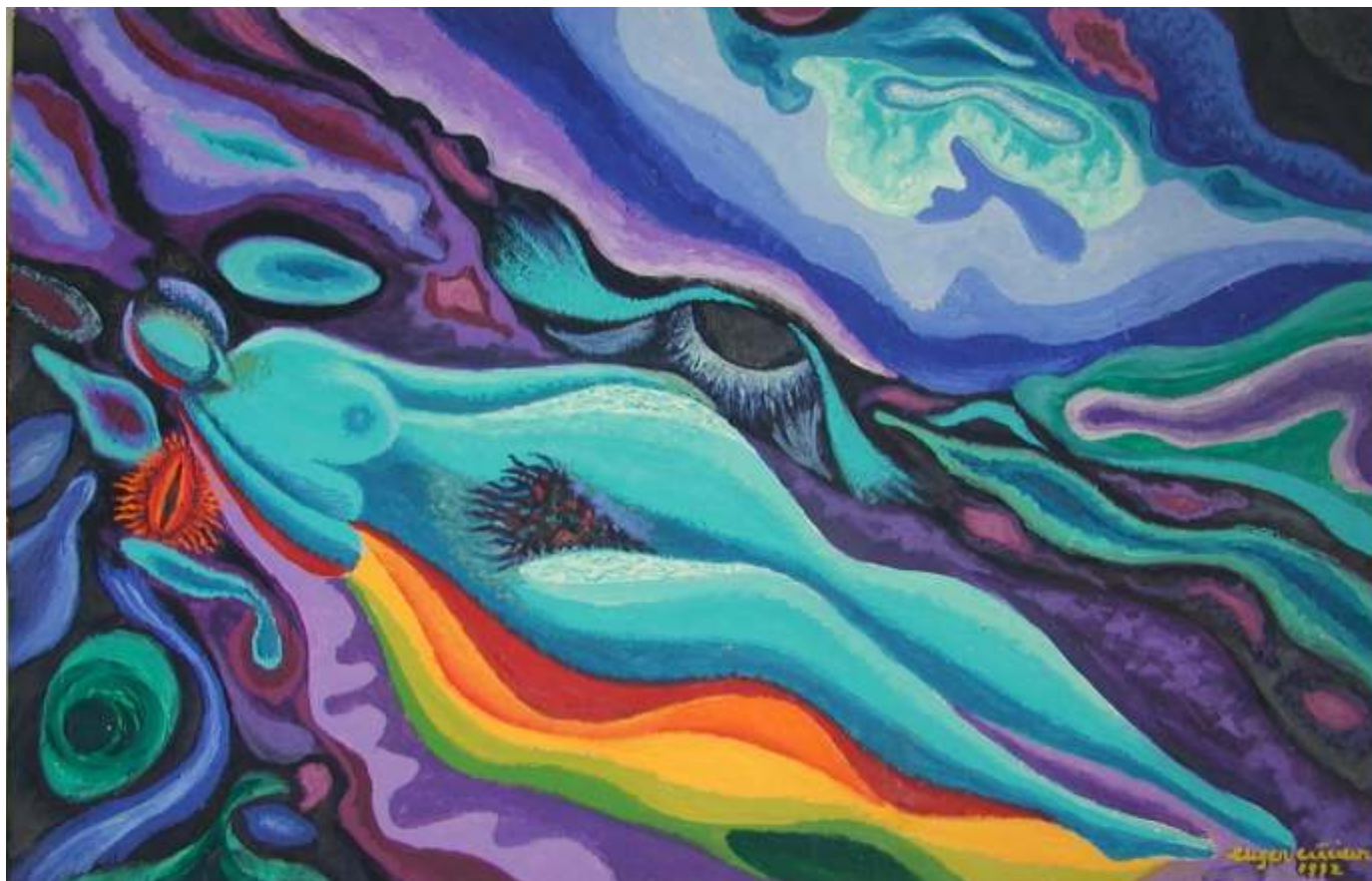
Nud în armonii albastre, 1992