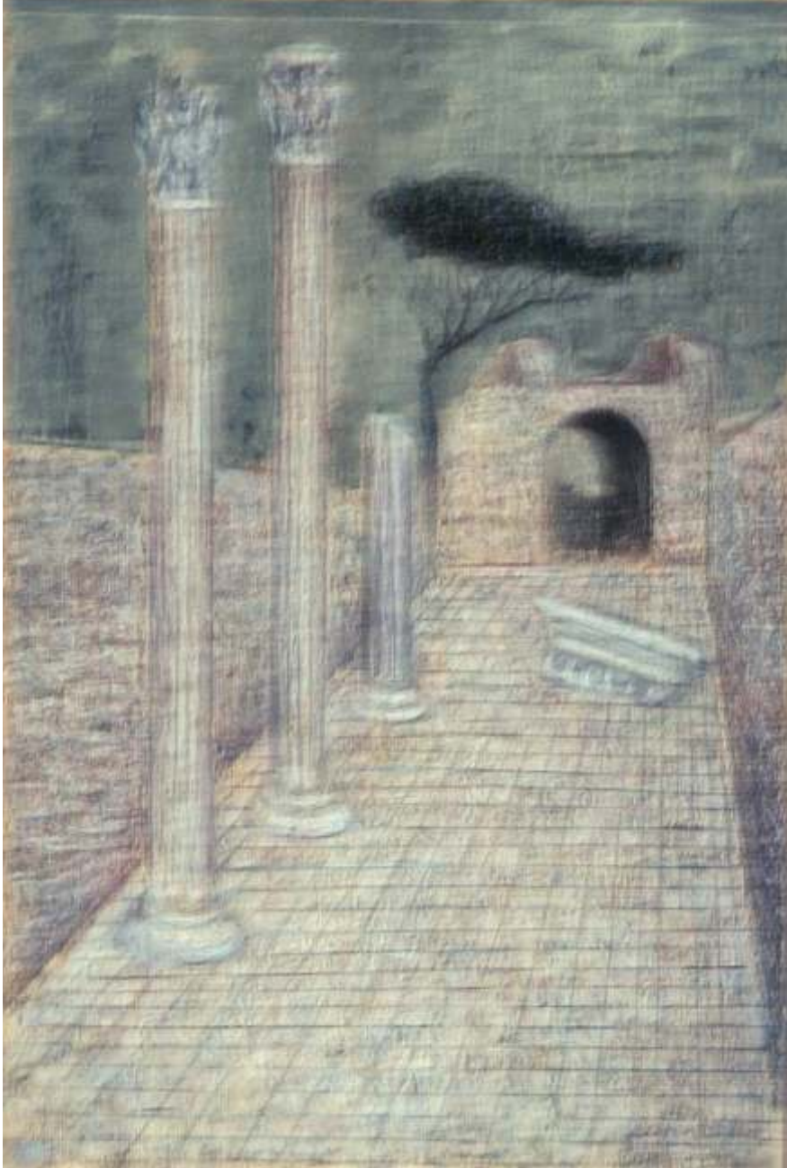
Peisaj din Roma, 1968