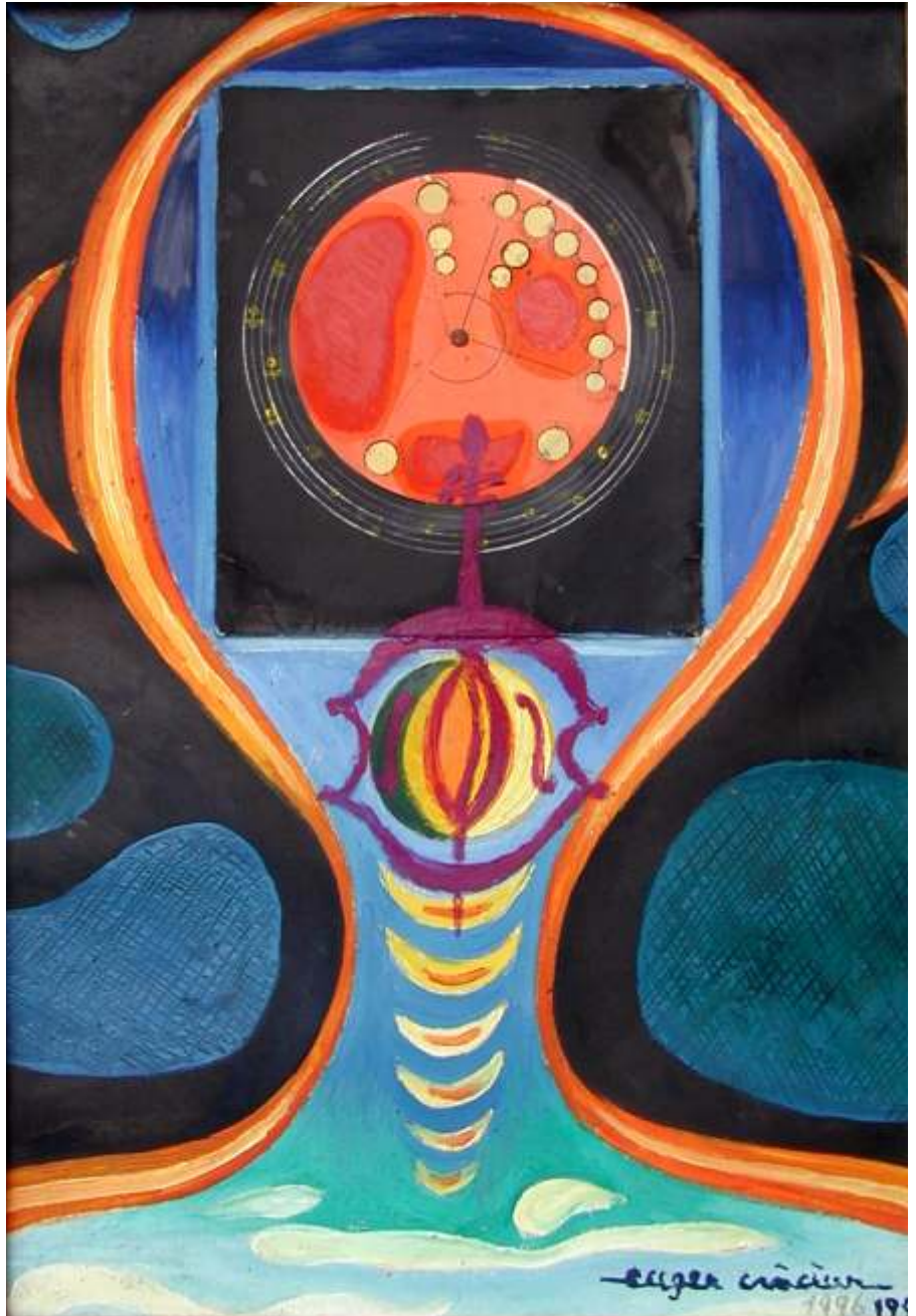
Structura cosmica, 1996