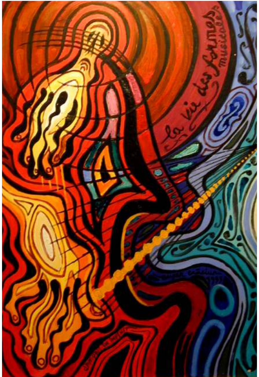
Vie des formes, 1996