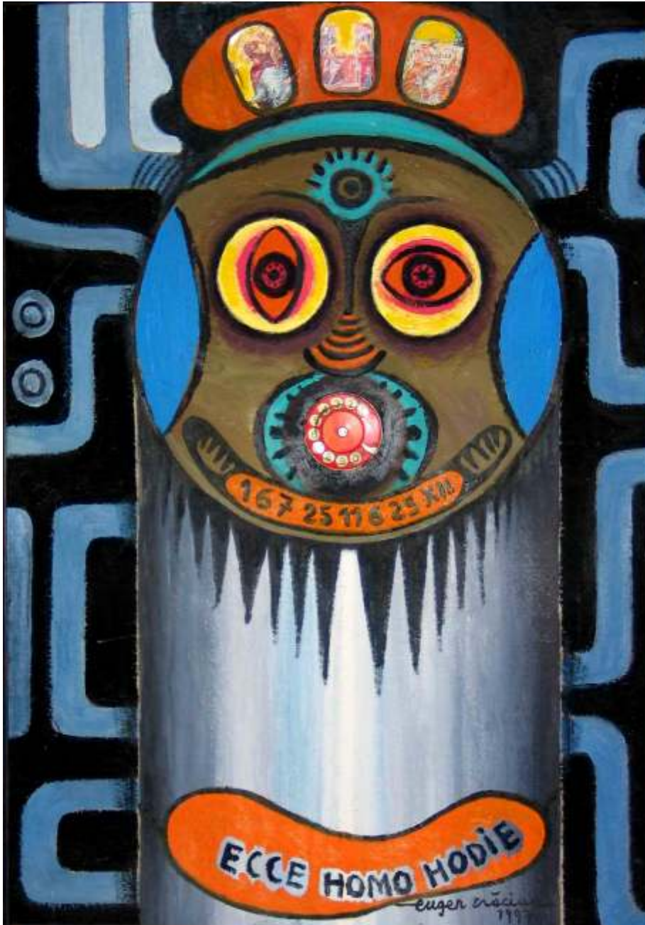
Ecce homo hodie, 1997