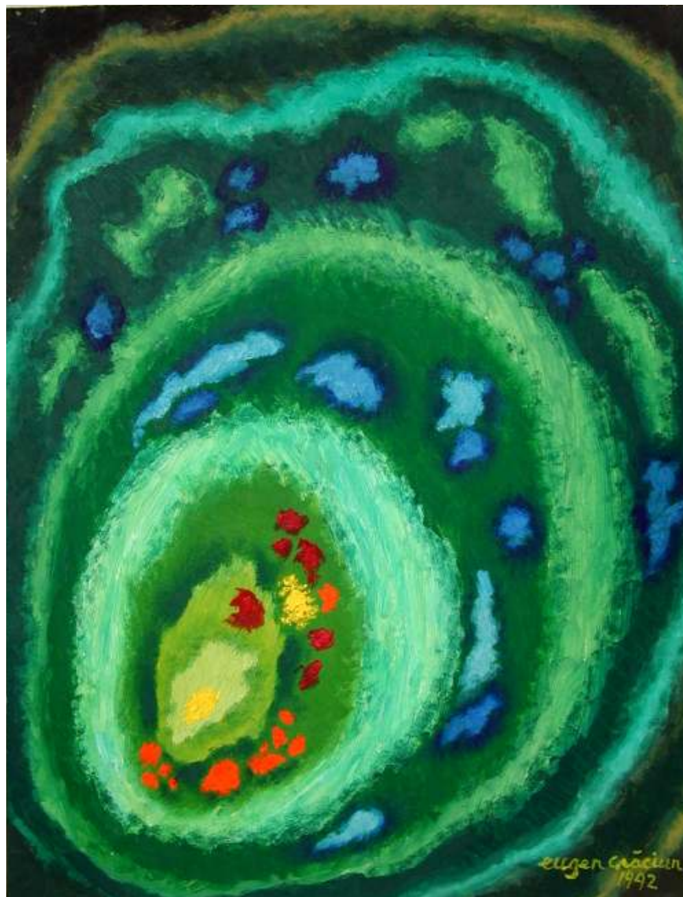
În verde, 1992