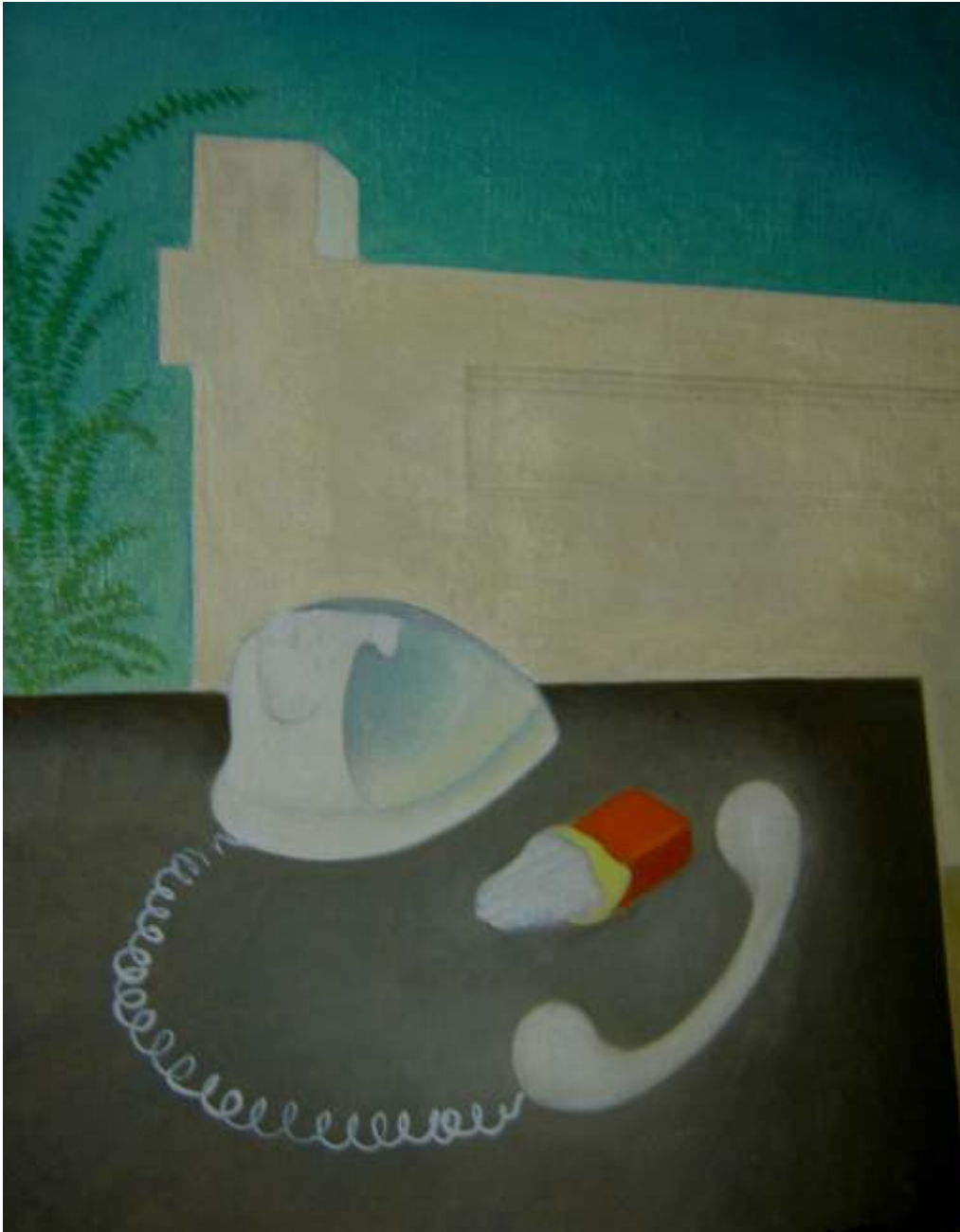
Dimineața caldă, 1970