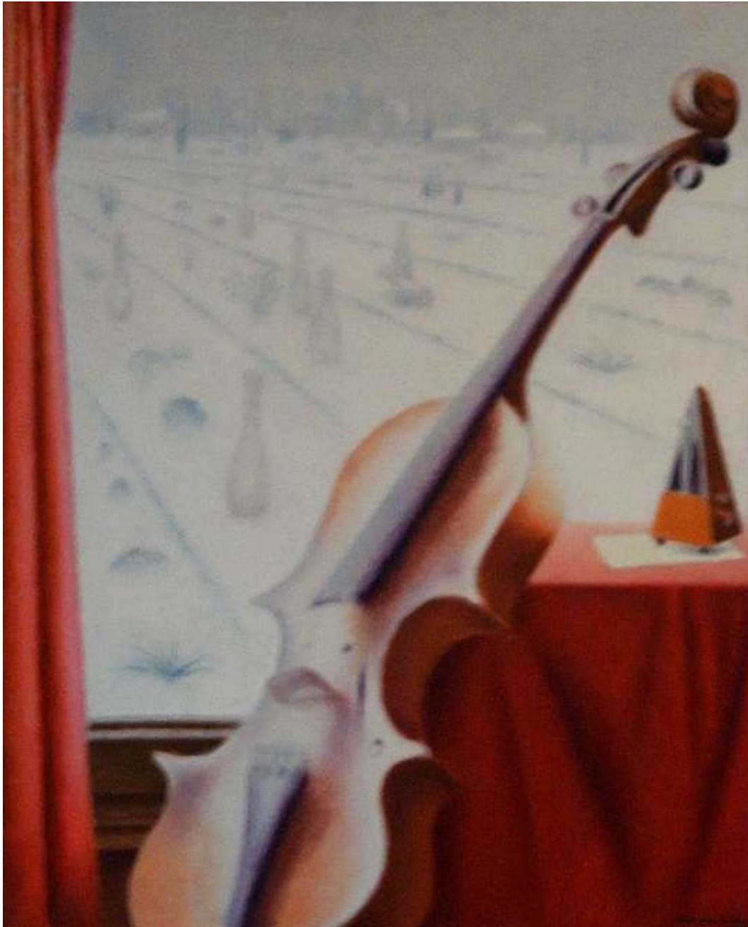
Vioara în iarnă