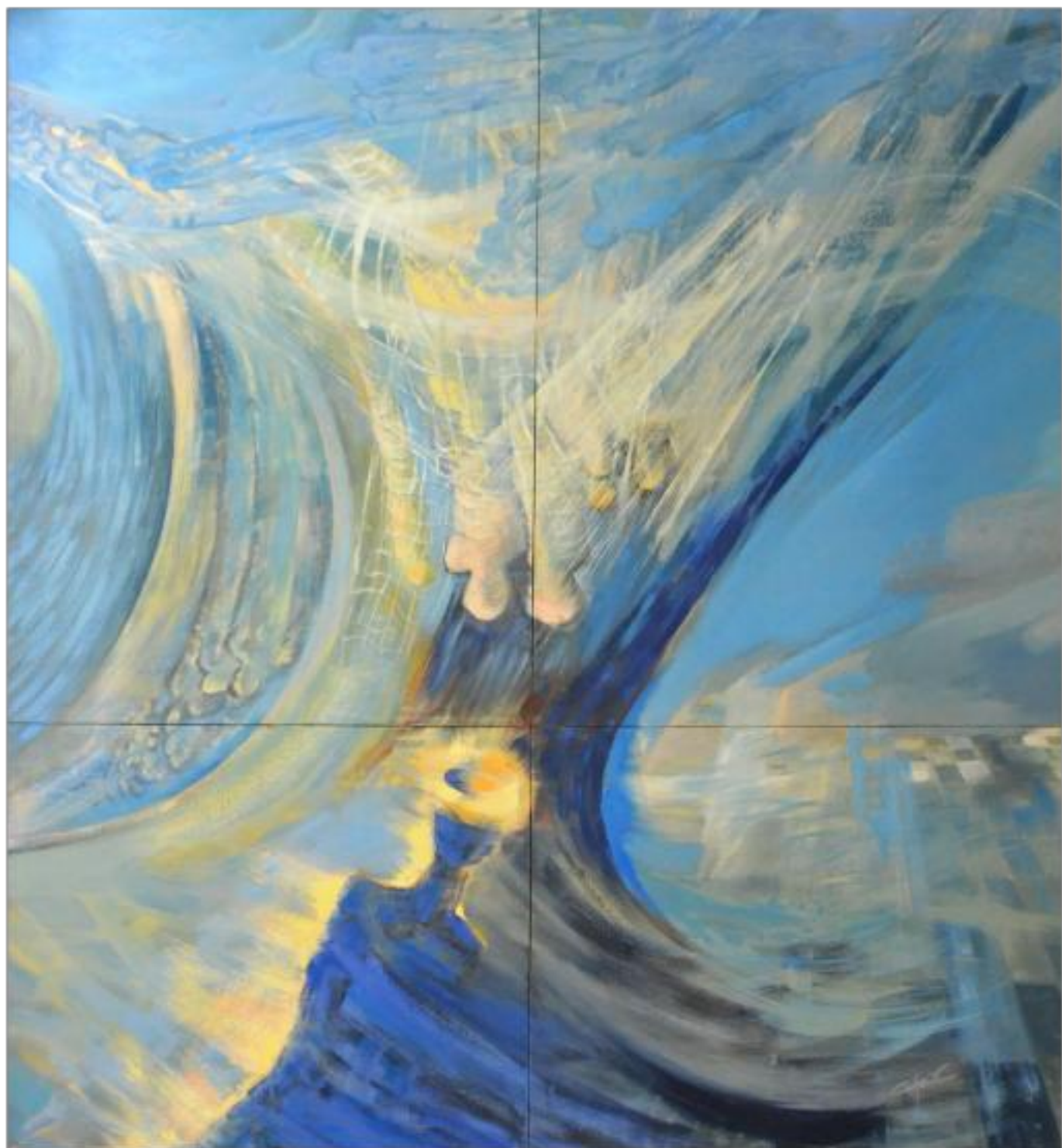
ENERGII UMBLĂTOARE ulei pe pânză 260 x 240 cm 1998