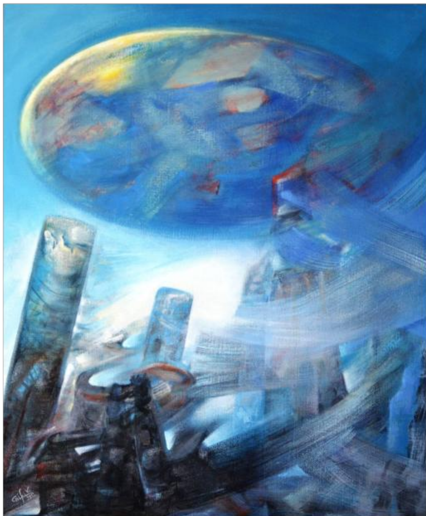
NOCTURNĂ ulei pe pânză 120 x 100 cm 2012