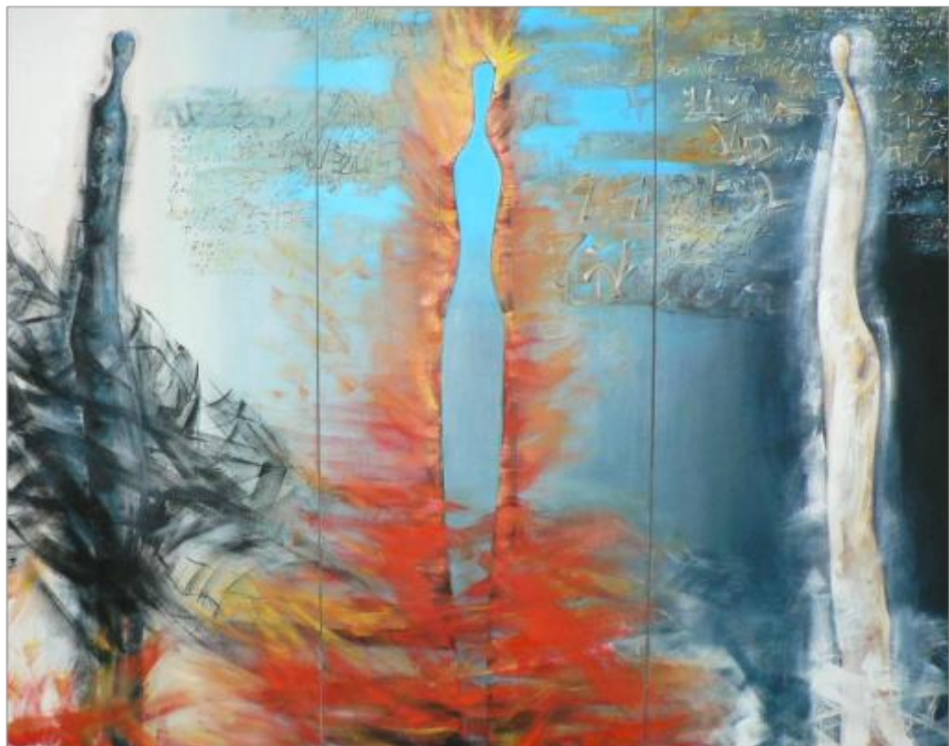
ÎN TRE ALB ȘI NEGRU ulei pe pânză 210 x 270 cm 2007