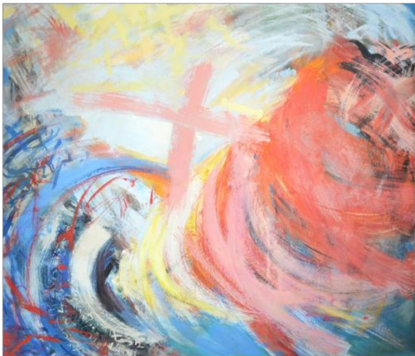
REĂNTOARCERE ulei pe pânză 135 x 150 cm 1992