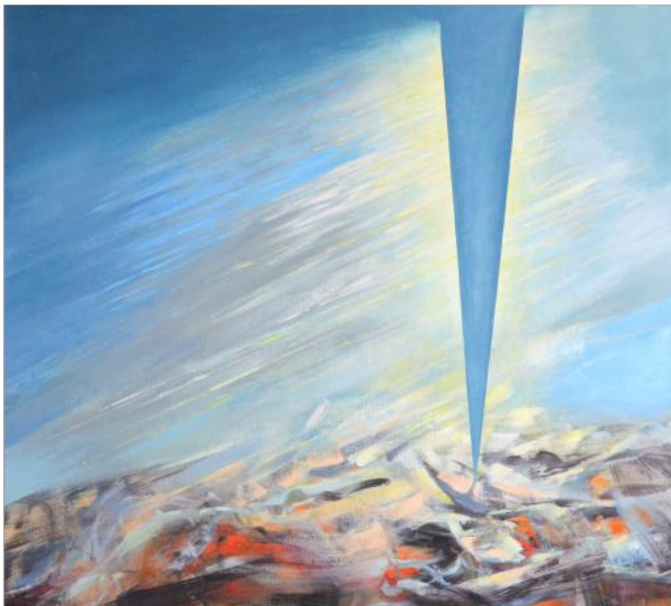
COMUNICARE ulei pe pânză 100 x 110 cm 2008