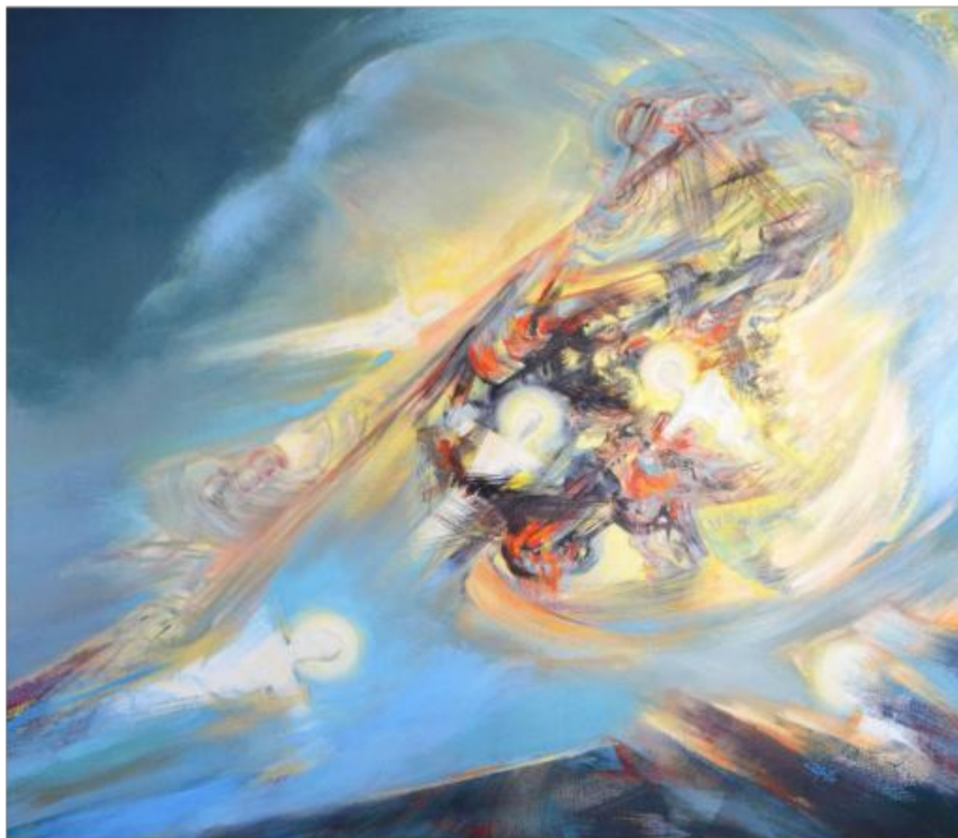
PURIFICARE ulei pe pânză 140 x 160 cm 2008