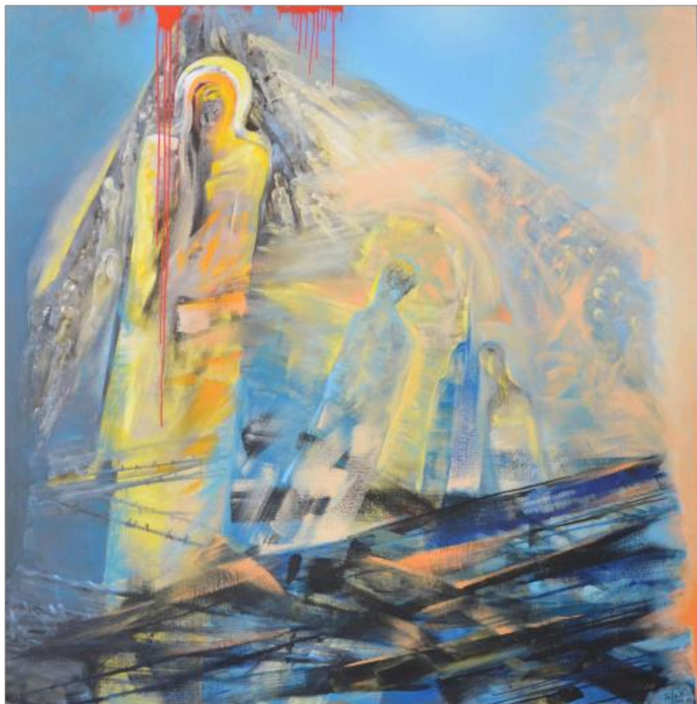
DINCOLO ulei pe pânză 200 x 200 cm 2005