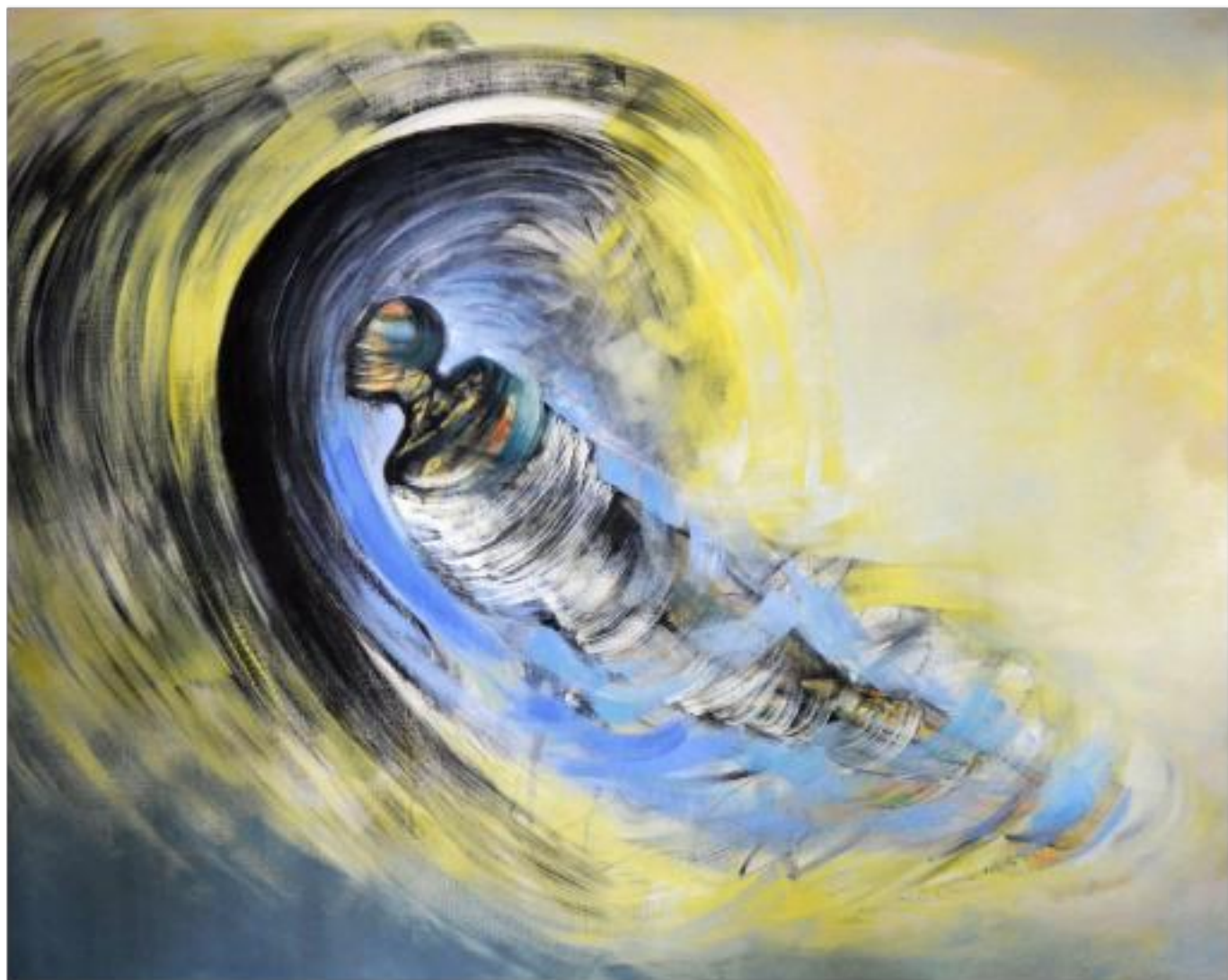
DESTIN ulei pe pânză 200 x 250 cm 2008