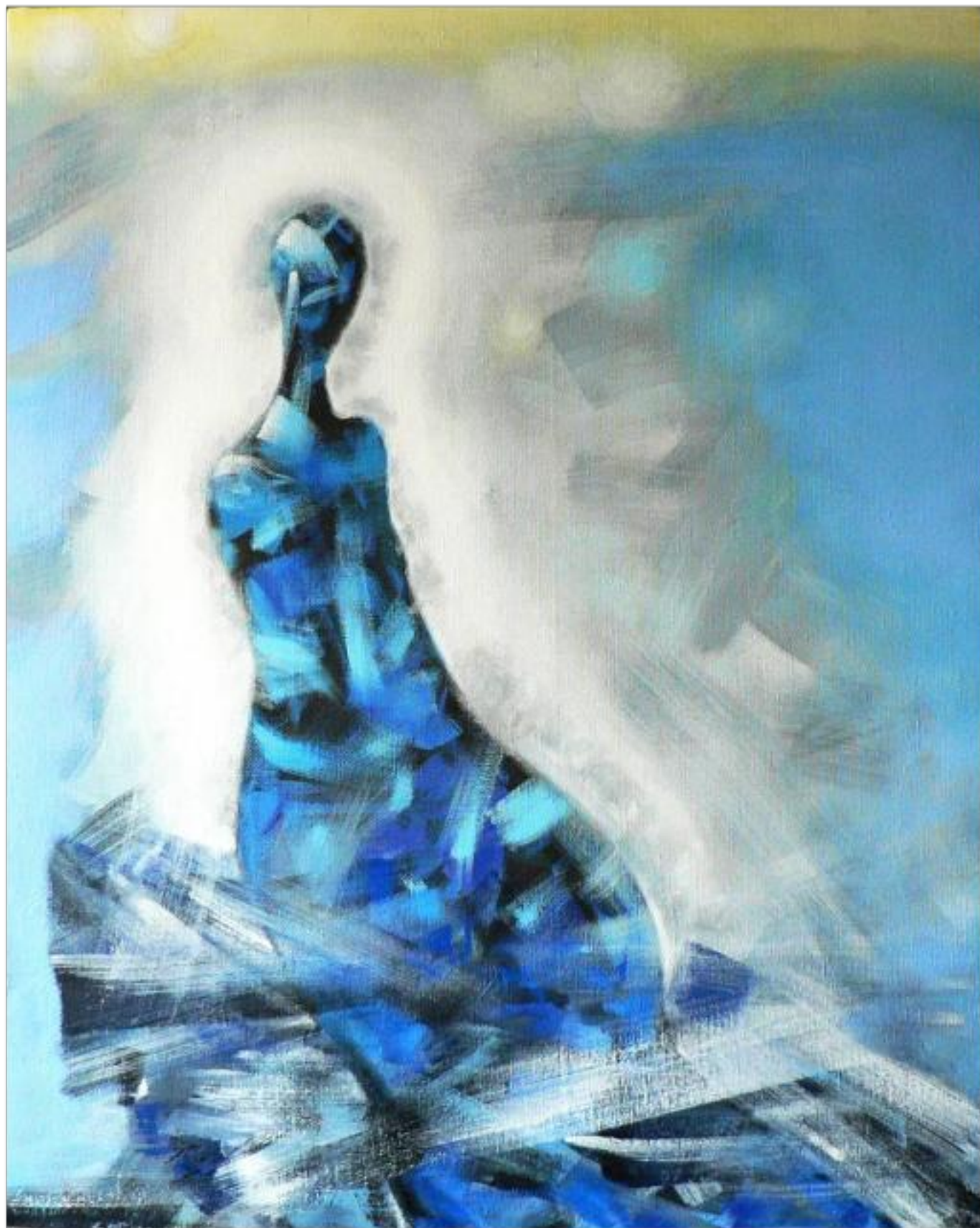
SINGURĂTATE ulei pe pânză 150 x 120 cm 2010