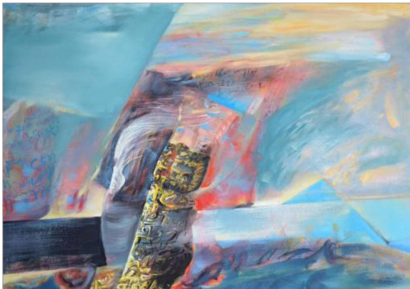
URME DE LA ÎNCEPUT ulei pe pânză 100 x 120 cm 2003