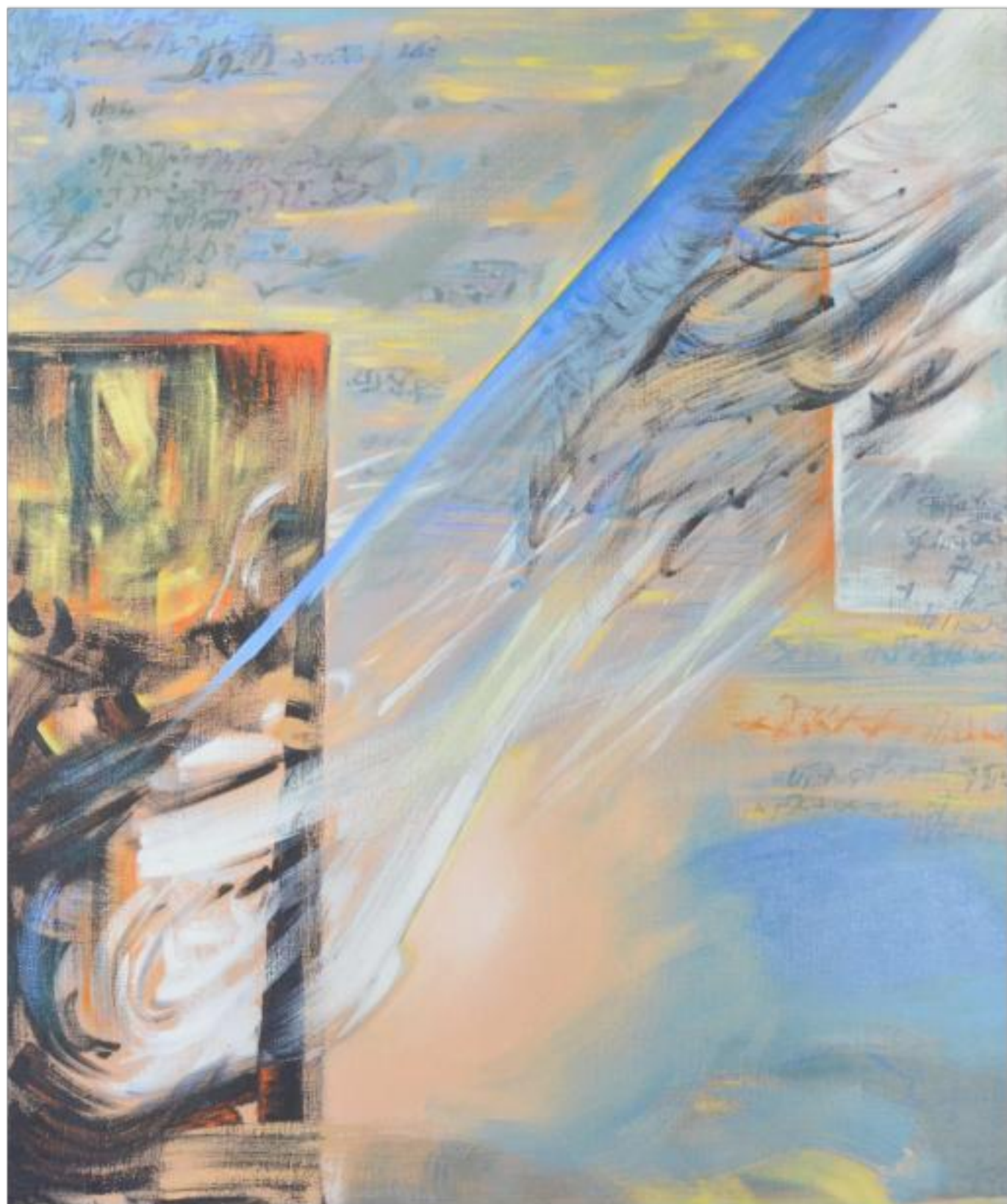
INTERFERENȚĂ ulei pe pânză 107 x 90 cm 2006