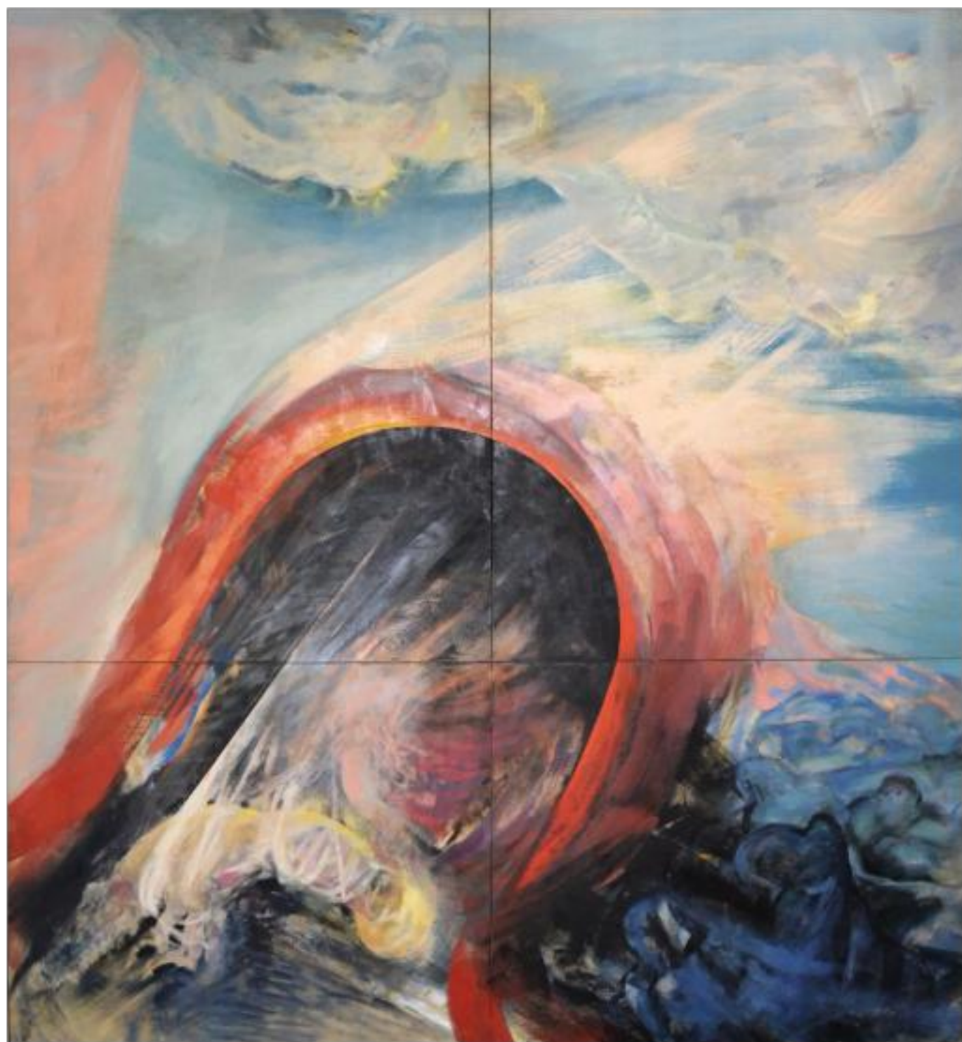
NAȘTEREA ulei pe pânză 260 x 240 cm 1997