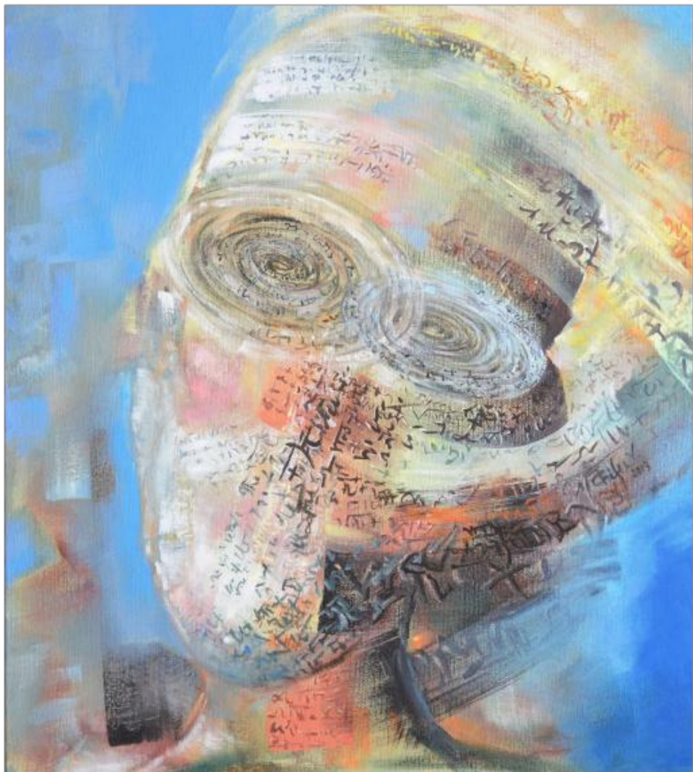
INTROSPECȚIE ulei pe pânză 90 x 80 cm 2013