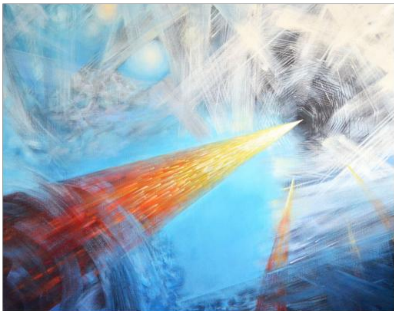
SPRE ALTE LUMI ulei pe pânză 200 x 158 cm 2010