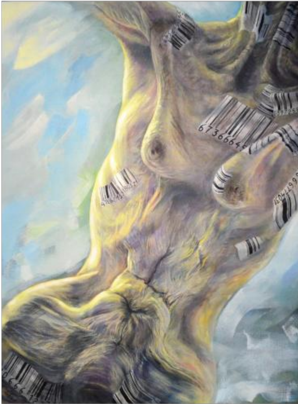
ÎNCEPUTUL MILENIULUI III ulei pe pânză, 200 x 150 cm, 2010

Concepție catalog și organizare expoziție: Alexandru Pamfil Tehnoredactare computerizată: Alexandru Pamfil