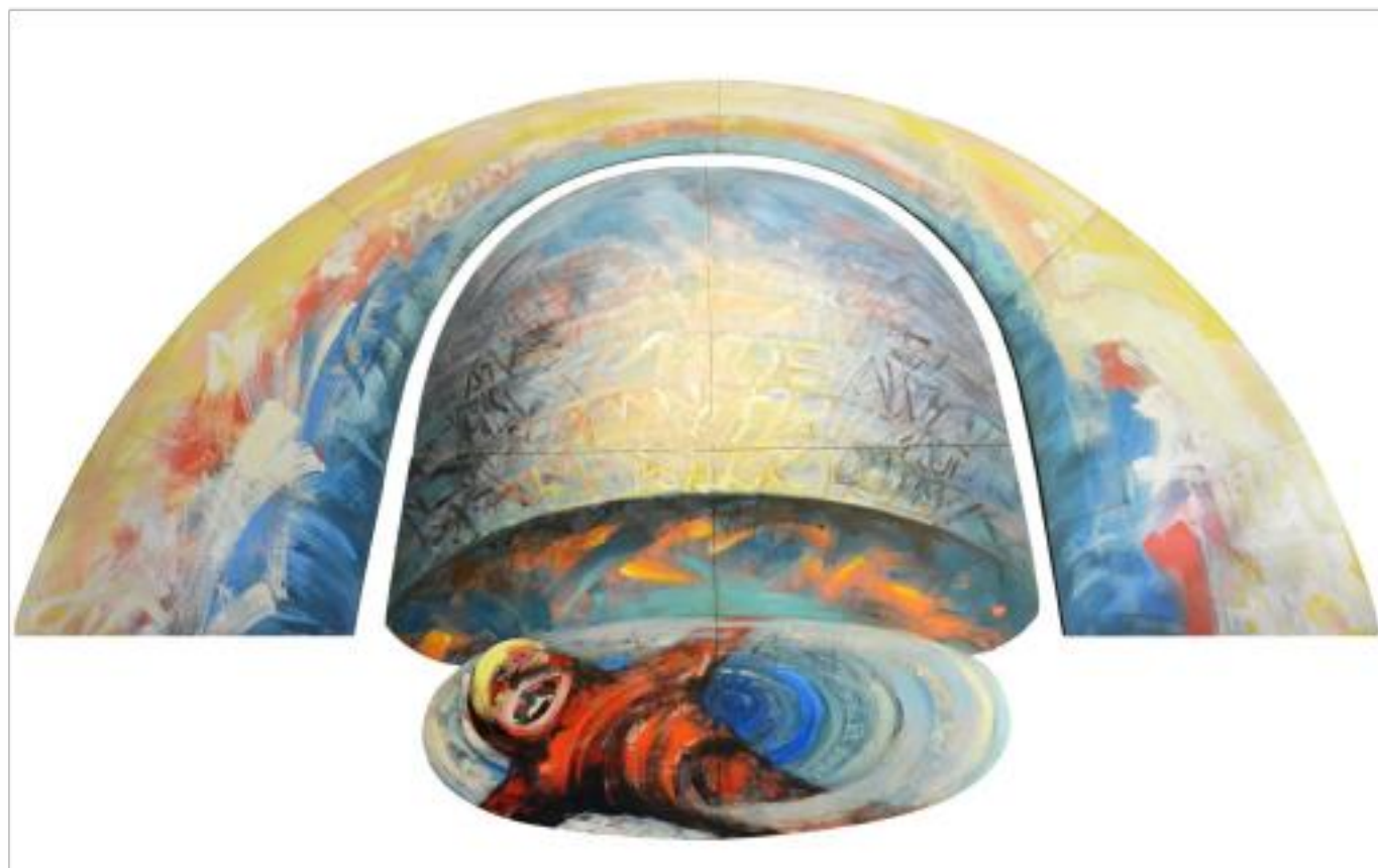
STRIGĂȚ VEȘNIC ulei pe pânză 320 x 500 cm 1993