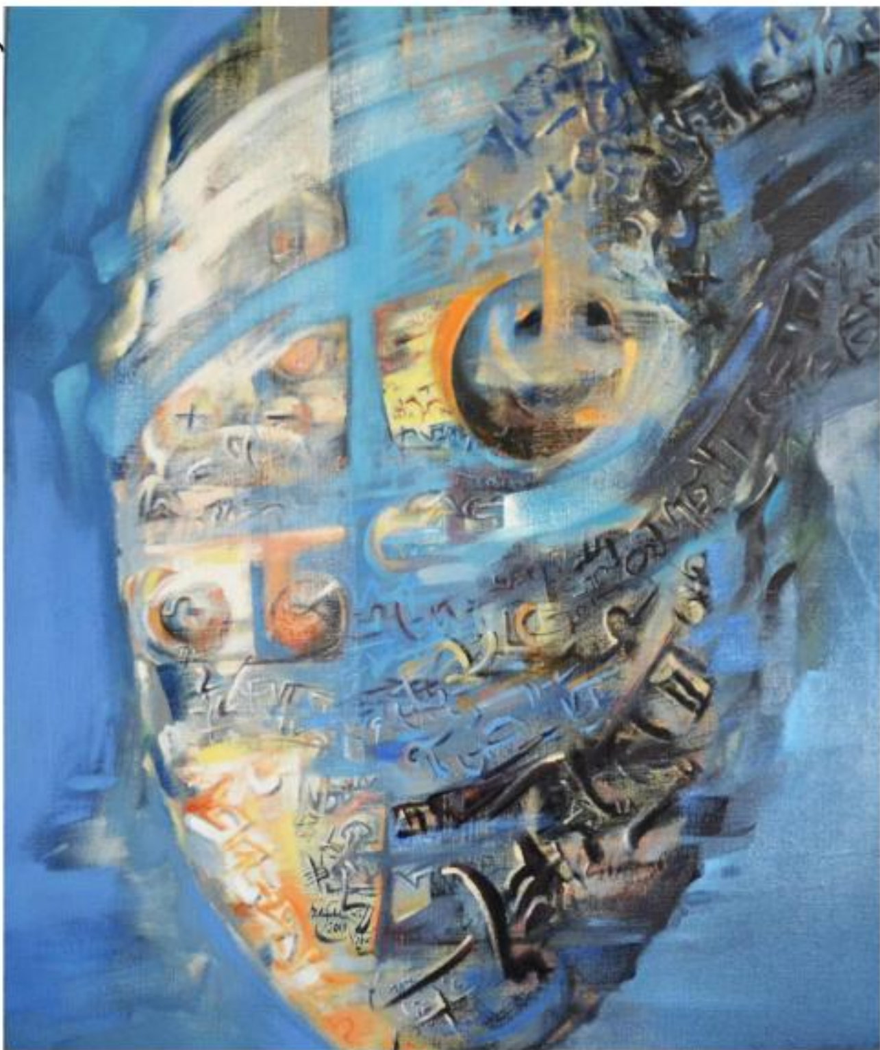
SCRISOARE CĂTRE PROPRIA FIINȚĂ ulei pe pânză, 100 x 90 cm, 2010