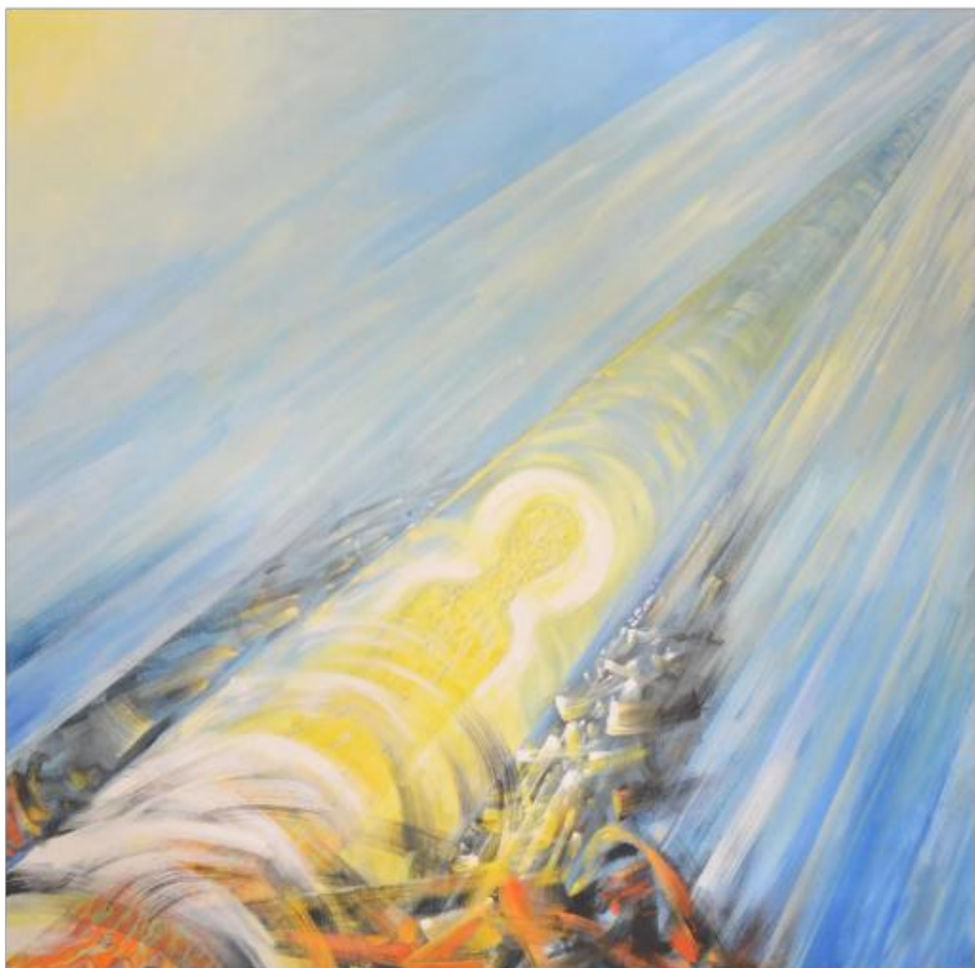
ASCENSIUNE ulei pe pânză 200 x 200 cm 2006