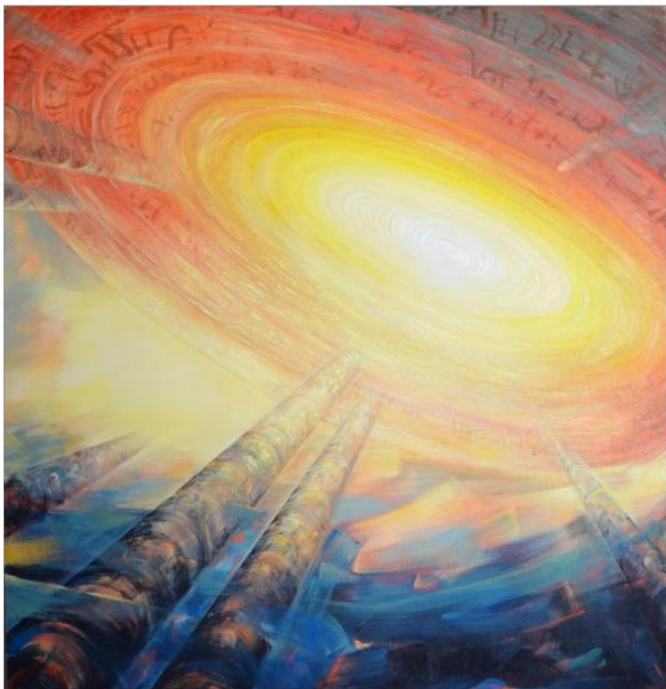
SPRE EL ulei pe pânză 200 x 190 cm 2007