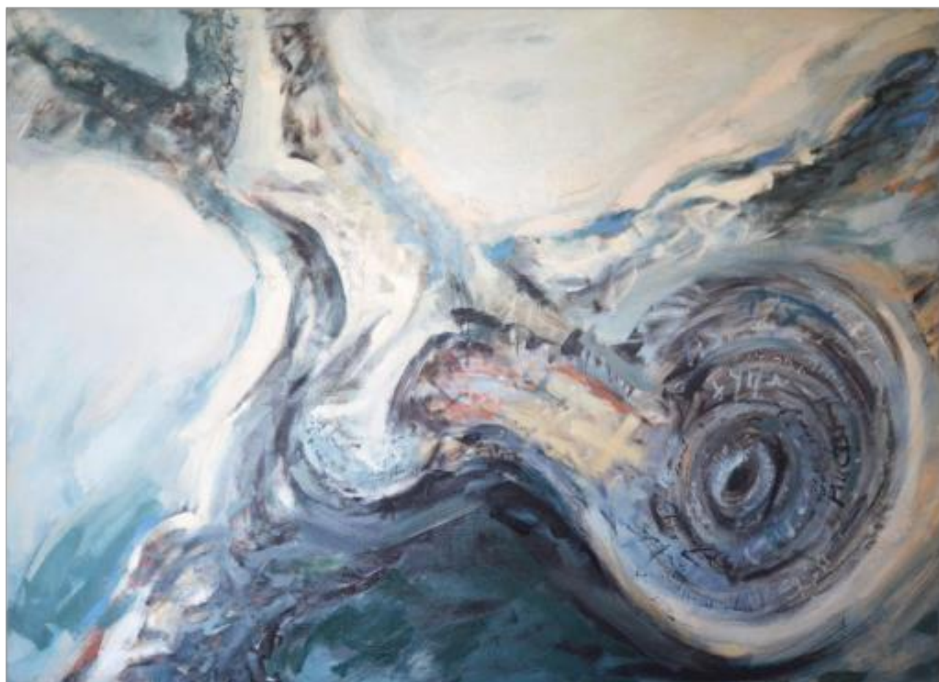
TIMP ulei pe pânză 135 x 180 cm 1990