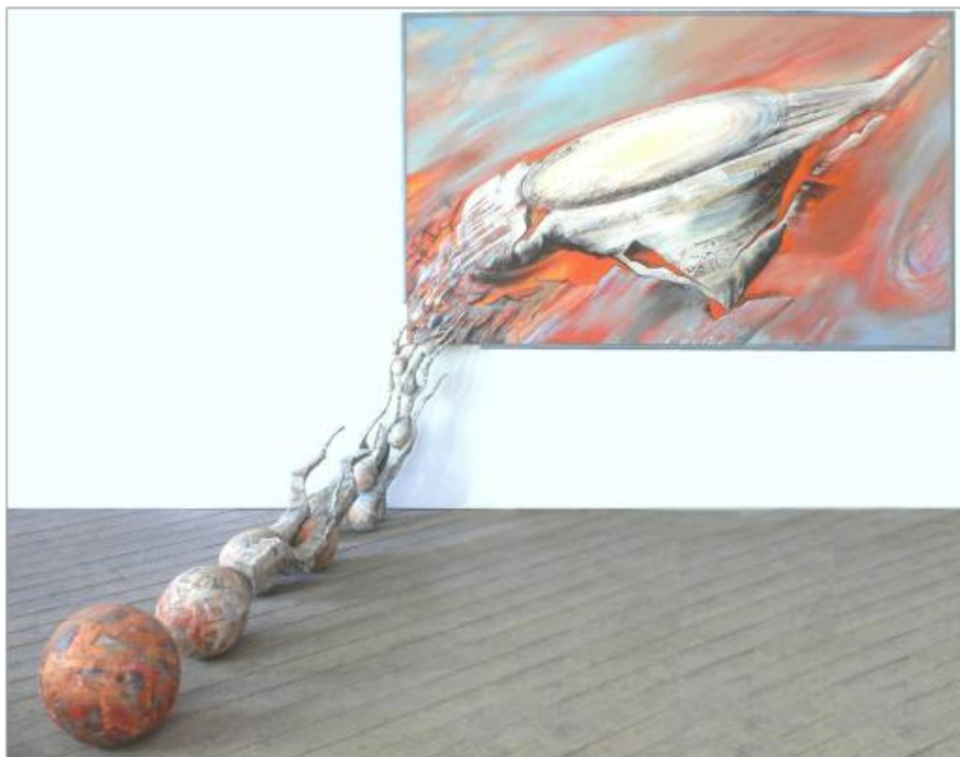
PRIVIND, VEI ȘTI CĂ TU EȘTI ACELA ulei pe pânză 360 x 260 x 217 cm 2008