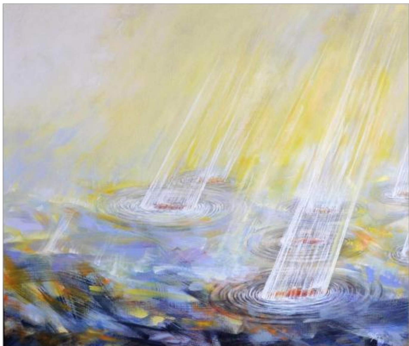
OCEANUL CU SUFLETE ulei pe pânză 150 x 140 cm 2008