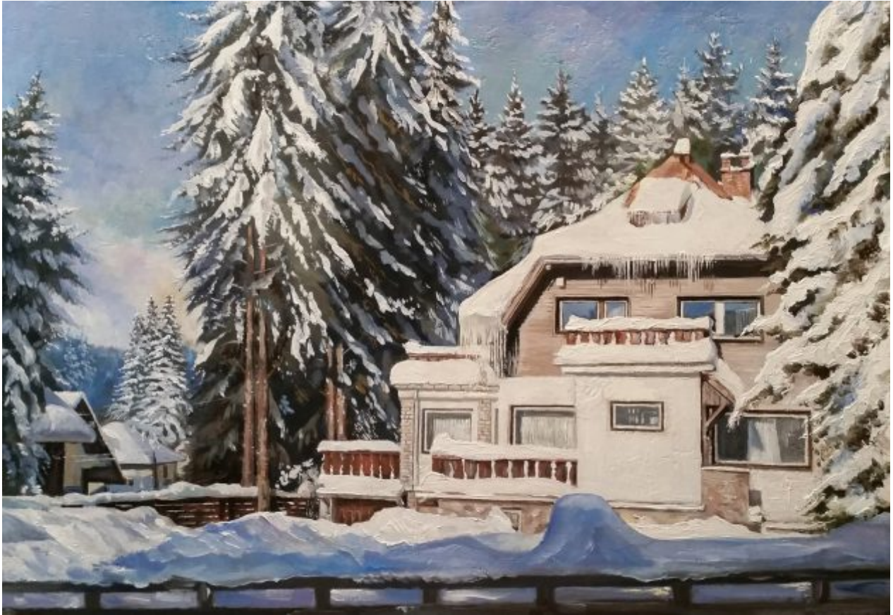
“PEISAJ DE IARNĂ. PREDEAL” ulei/levkas, 35 x 50 cm