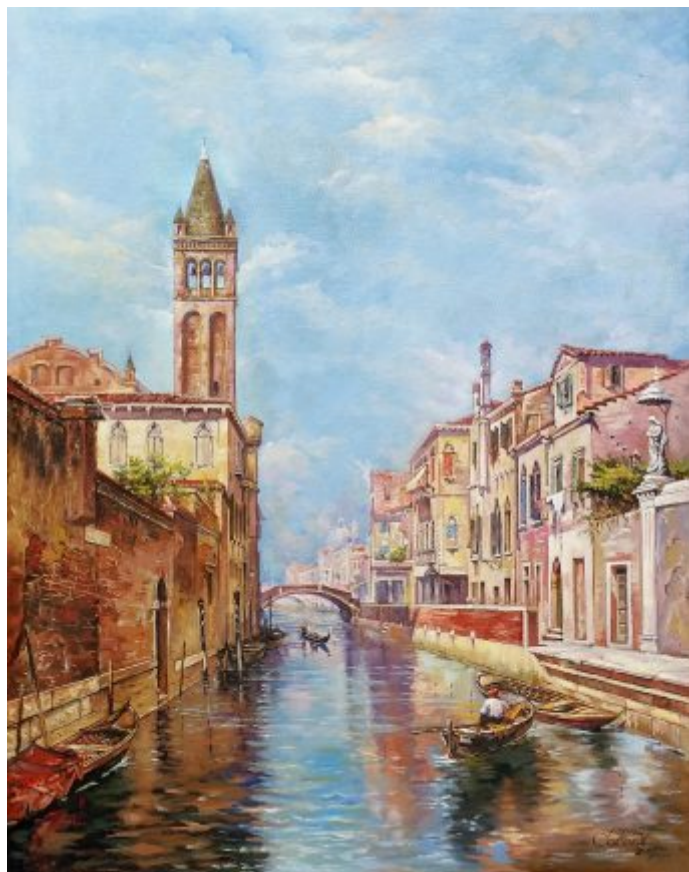
“VENEȚIA. CA REZZONICO”