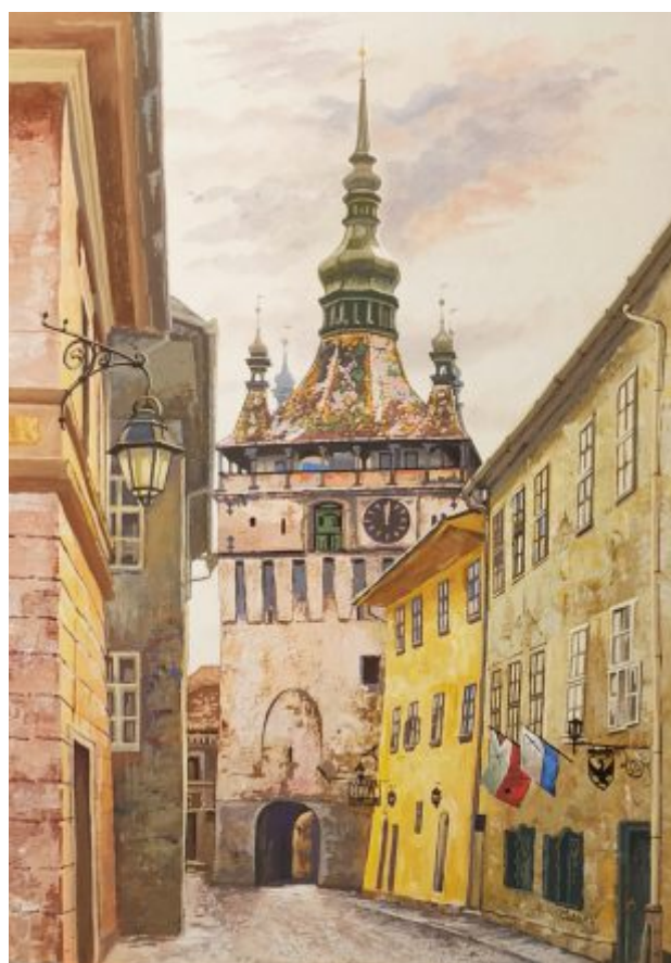
“SIGHIȘOARA. TURNUL CU CEAS” tempera, 40 x 30 cm