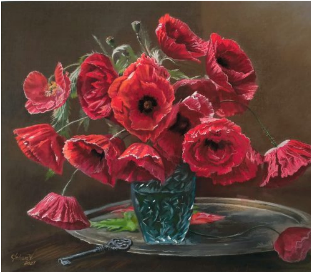
"BUCHET MACI" pastel, 40 x 50 cm