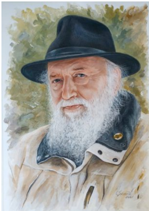
“GIGI BOBU” mixtă, 42 x 30 cm