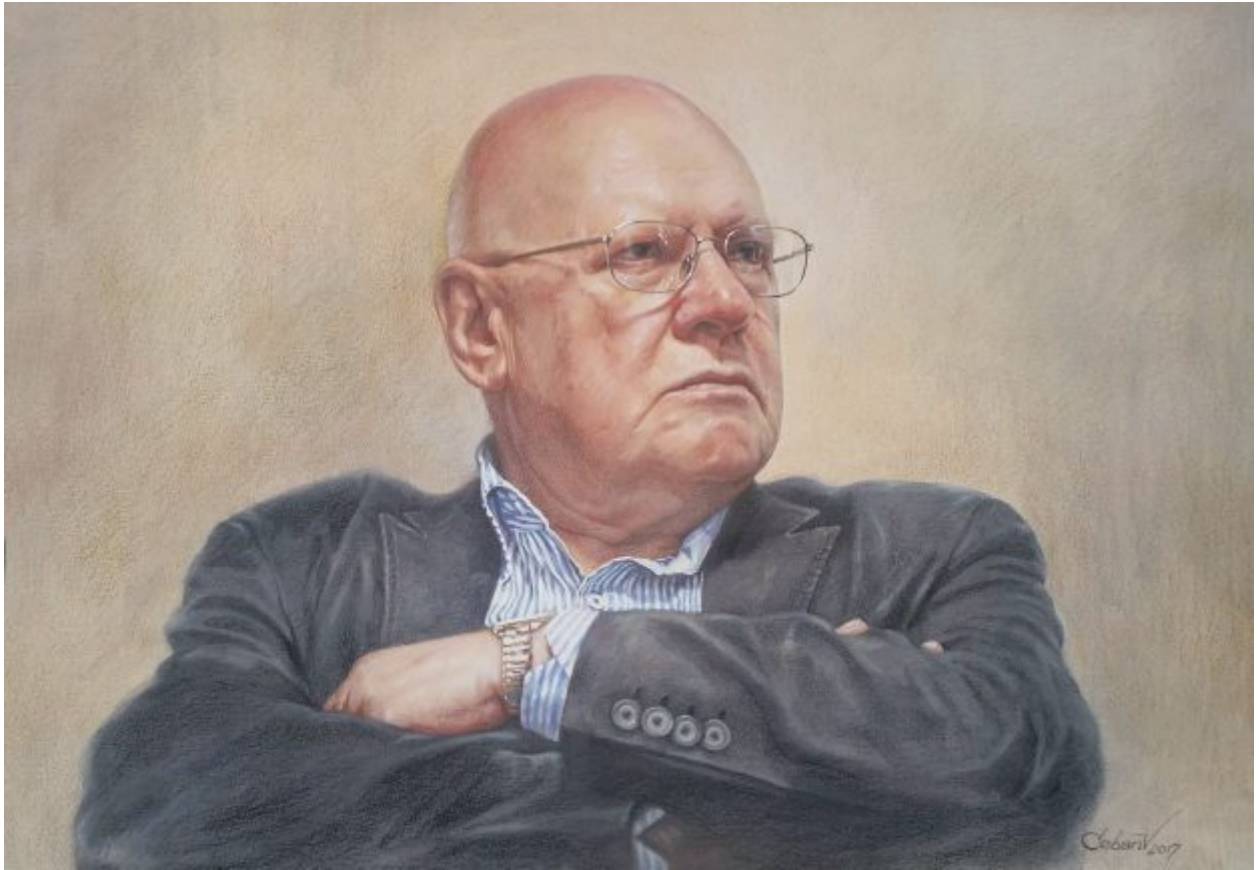
“RĂZVAN THEODORESCU” mixtă, 50 x 35 cm