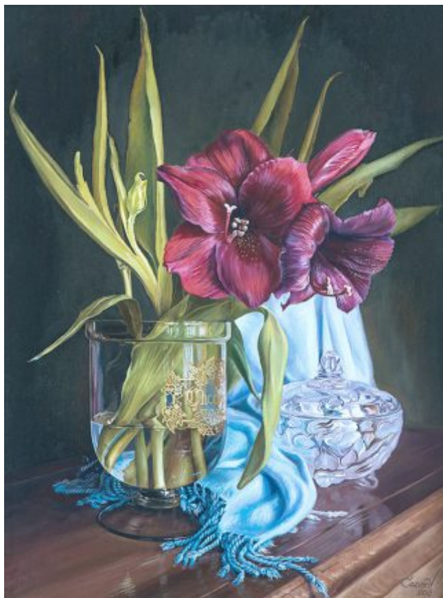
“NATURĂ STATICĂ CU AMARILLIS” ulei/pânză, 60 x 45 cm