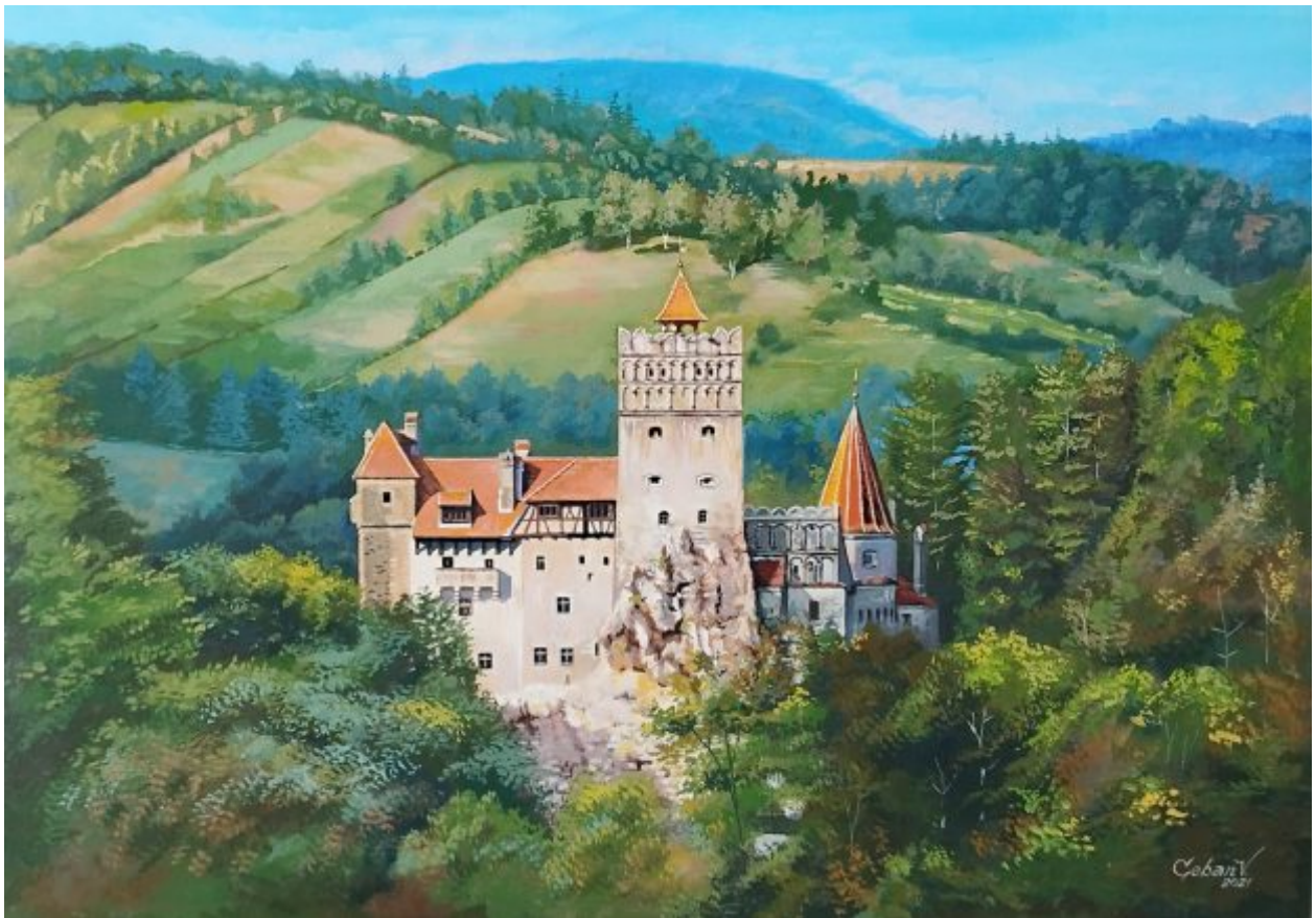
“CASTEL BRAN 2” tempera/hârtie, 35 x 50 cm