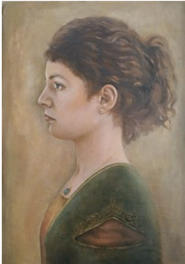
“ANA MARIA” ulei/lemn, 42 x 30 cm