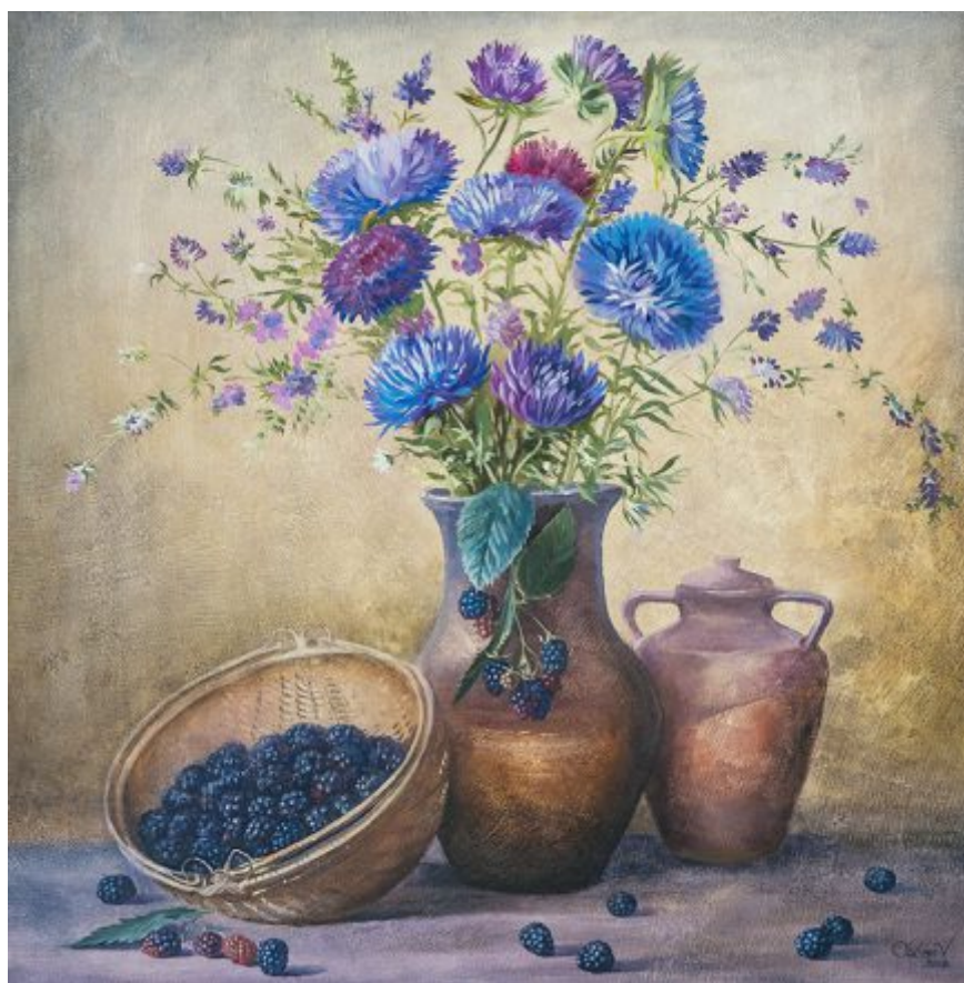
“NATURĂ STATICĂ CU CRIZANTEME” ulei/pânză, 60 x 60 cm