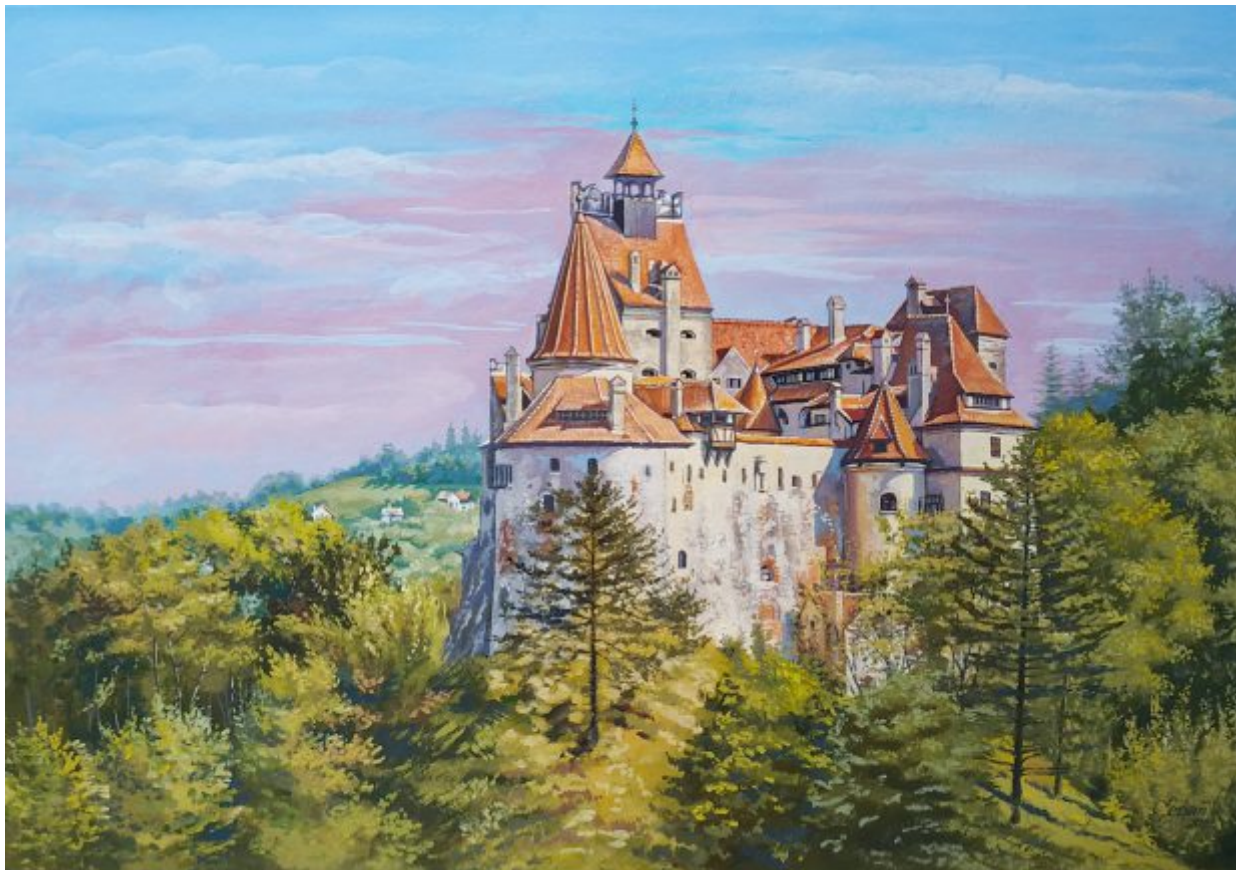
“CASTEL BRAN 1” tempera/hârtie, 35 x 50 cm