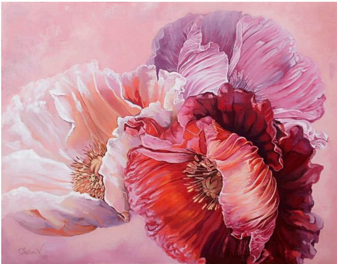
"FLORI" tempera/levkas, 38 x 48 cm