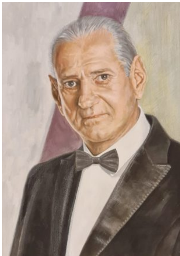
“GHEORGHE ZAMFIR” mixtă, 50 x 35 cm